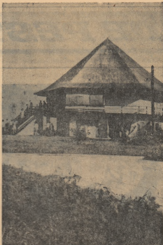
Restaurantul de pe insula Ocidia

Telegrame adresate tavorșului Chivu Stoica sînt semnate de Elisabeta, regina Marii Britanii, Urho Kekkonen, președintele Republicii Finlanda, Hirohito, împăratul Japoniei, arhiepiscopul Makarios, președintele Republicii Cipru, Habib Burgiba, președintele Republicii Tunisia, Baudouin, regele Belgiei, Mohammad Reza Pahlavi, șahingahul Iranului, Gamal Abdel Nasser, președintele Republicii Arabe Unite, dr. Zakir Husain, președintele Republicii Indiei, Lyndon B. Johnson, președintele Statelor Unite ale Americii, Haile Selassie I, împăratul Etiopiei, Iuliana, regina Olandei, general-locotenent Joseph Arthur Ankrah, președintele Consiliului Național de Eliberare din Ghana, Moktar Ould Daddah, președintele Republicii Islamice Mauritania, Arthur da Costa e Silva, președintele Republicii Brazilia, general Oscar D. Gestido, președintele Republicii Orientale Uruguay, Norodom Sihanouk, regele statului Cambodgia, Ne Win, președintele Consiliului Revoluționar al Uniunii Burmaneze, Ahmadou Ahidjo, președintele Republicii Federale Camerun, Charles Helou, președintele Republicii Liban, M. Ayub Khan, președintele Pakistanului, Zalmay Shazar, președintele Israelului, general-locotenent Abdul Rahman Mohammed Aref, președintele Republicii Irak.