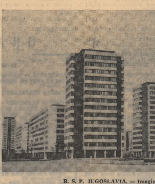
R. S. F. YUGOSLAVIA. — Imagine din Belgrad

Intr-o situație din Nigeria evoluează pe coordonatele cunoscute: în apropiere de Biafra ca și de provincia de centru-vest continuă să aibă loc lupte, dar rezultatele reale nu sînt cunoscute datorită comunicărilor militare contradictorii. Amîndouă părțile, relatează corespondentul agenției Reuter, au declarat că dețin controlul asupra orașului