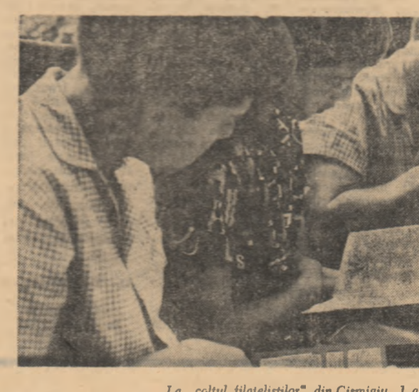
La „colțul filatelistilor” din Cișmigiu. 1 august 1967

În întreaga activitate pe care o desfășoară la marea de tineret, organizațiile U.T.C. trebuie să manifeste suplete și receptivitate la non, să evite sablonismul în muncă, procedeele care s-au uzat de prea multă întrebuintare, adaptându-și necontenit formele de activitate după seismografurile sensibile și de mare excitare al preferențelor tinerilor. Este un deziderat la care obligă însăși realitatea în continuă mișcare și transformare a societății noastre.