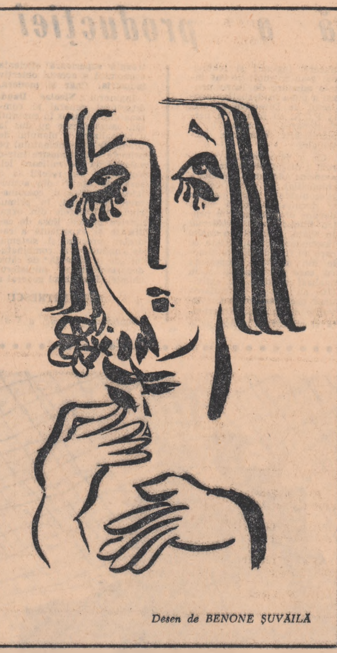
Desen de BENONE ȘUVĂILĂ

Ion Buleandru (ducele de Alba) are o apariție excelent concepută și deși nu rămâne la același nivel el explică personajul printr-o uniune de virilitate și inteligență perfidă.