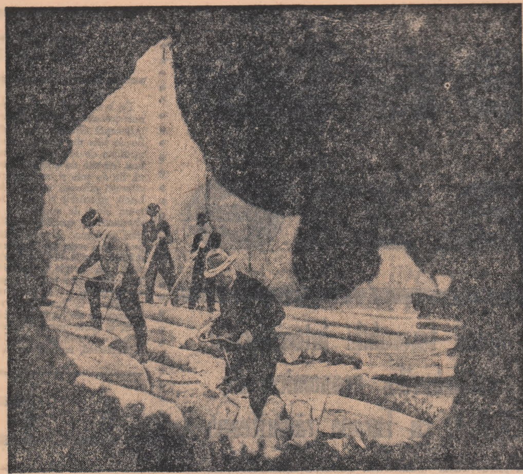
Pe rampa de apropiere, transport și sortare a masei lemnoase exploatare a Exploatării forestiere Izvorul Tăsei (I. F. Nelu)