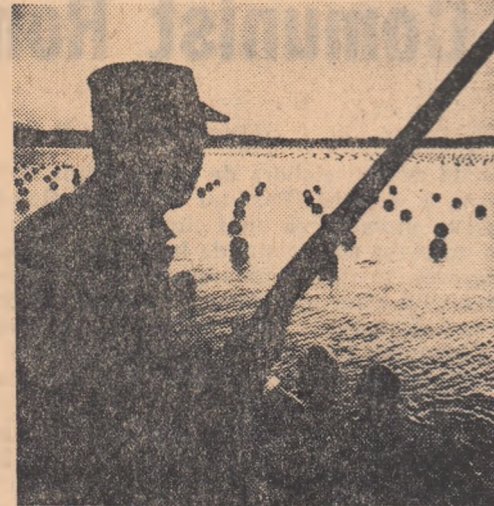
Gărzi bine înarmate veghează metamorfoza perlei...