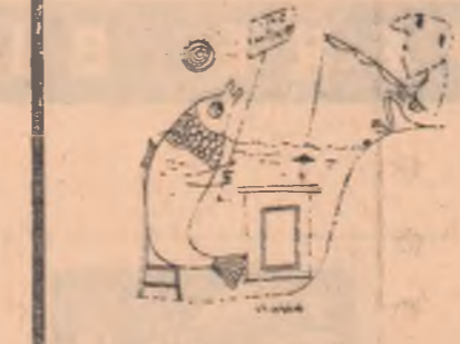
Desene de VASILE NAȘCU.