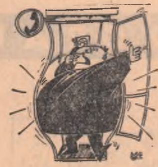
Alo, salvarea?... Desen de GROSU MIHAI

cu servietă, întrebat unde e vizavi l-a îndreptat spre omul cu șoricar. Nu s-a dus stînd că acolo nu era vizavi. A mai trecut odată strada la îndemnul unei cucoane. Aici în nici un caz nu poate fi vizavi. S-a convins întrebînd un copil. — Vizavi? Nu-i aici. E dincolo. Dincolo l-au ajutat doi tineri care mergeau tîndu-se de braț. — Vizavi este acolo unde nu sîntem noi, i-au spus amîndoi fericiți. I-a crezut pentru că erau dol. Pe cealaltă parte a străzii a oprit un bătrîn cu o sacoșă plină cu gutul, apoi un student, un om care citea ziarul, o femeie și doi balerini! La fărâ cinci a întrebat un șofer de taxi, o fată cu ochelari, doi caporalii, trei elevi în drum spre meditație, și un zugrav. Apoi s-a urcat pe balustrada podului Elefterie și s-a aruncat în Dimbovită. Cum stătea înfipit cu capul în mîlul apelor, cu piciorarele perfecte întinse, nu parea deloc o trestie gînditoare.