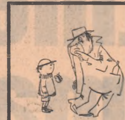
— Ai uitat și la chenzina asta să-mi trimiți pensia alimentară?... — Păi d-ai avut beauf... să uit... că am uitat. Desen de N. CLAUDIU