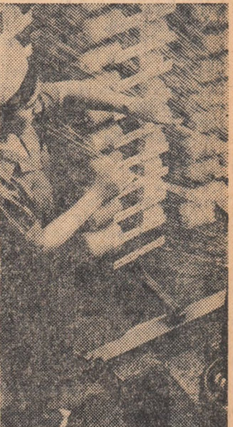
Controlînd calitatea firelor (Fabrica de stofe de mobilă-București)

Adresîndu-se sărbătoritului, tovarășul Nicolae Ceaușescu l-a felicitat călduros în numele Comitetului Central al Partidului, al Consiliului de Stat și al guvernului cu prilejul conferirii înaltei distincții. Aceasta, a spus președintele Consiliului de Stat, constituie o pretuire a muncii depuse de tovarășul Daicoviciu pe mai