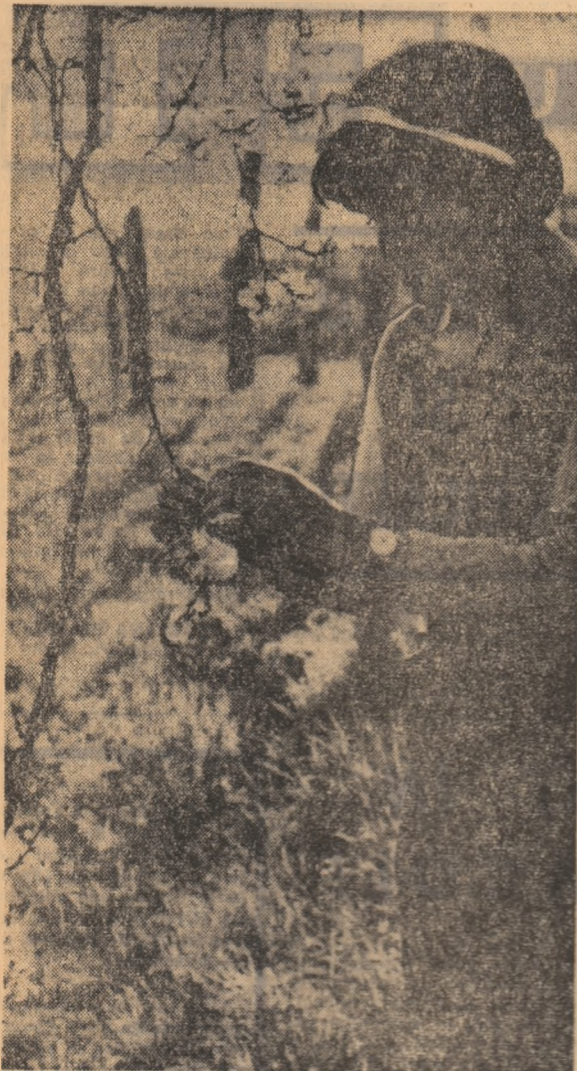
O clipă de romantism? Nu, este corba de o aplicație practică la Liceul agricol din Șimleu Silvaniei.