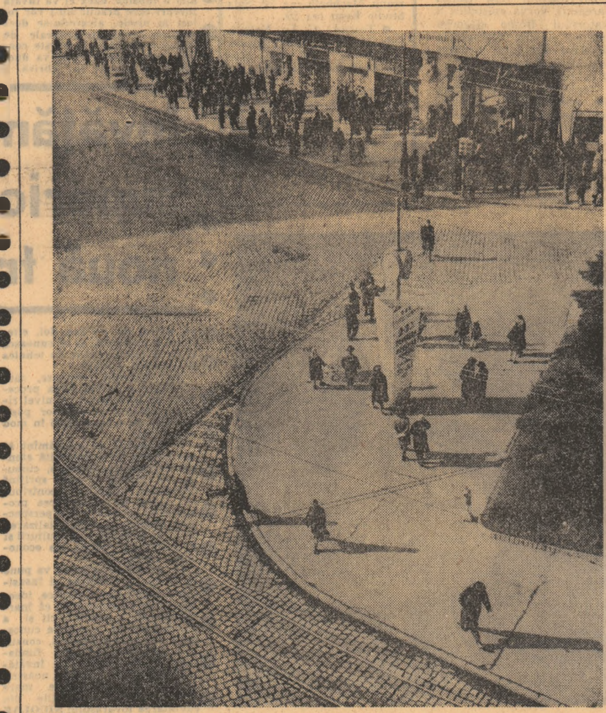
Venit în Timișoara, plimbîndu-te pe străzile pline de soare, pe malarile Begăi străjuite de silcii pletose, ajungi dintr-odată parca, acolo unde în intersecția cu asfaltul, parcul dă caracteristica orașului — Corso.