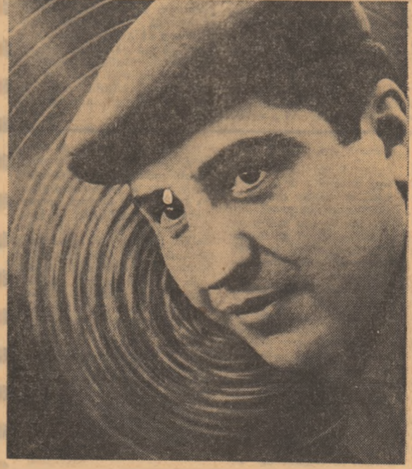
Un „efect de optică” industrială