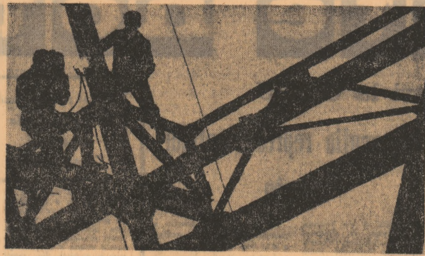
...Se vedează legătura între pămint și aer

In cadrul discutiilor, desfășurate într-o atmosferă caldă, tovarășească, a avut loc un schimb de păreri în probleme de interes comun pentru cele două partide.