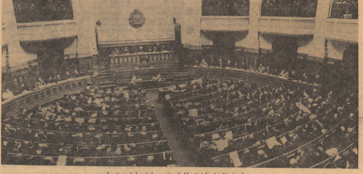
In timpul lucrărilor sesiunii Marii Adunări Naționale

Deputații au adoptat în unanimitate următoarea ordine de zi: 1. Proiectul de lege pentru dezvoltarea construcției de locuințe, vinzarea de locuințe din fondul de stat către populație și construirea de case proprietate personală de odihnă sau turism. 2. Proiectul de lege privind administrarea fondului locativ și reglementarea raporturilor dintre proprietari și chiriași. 3. Proiectul de lege privind învîmînțul în Republica Socialistă Română. 4. Proiectul de lege cu privire la apărarea, conservarea și folosirea terenurilor agricole. 5. Proiectul de lege privind organizarea cooperării meșteșugărești.