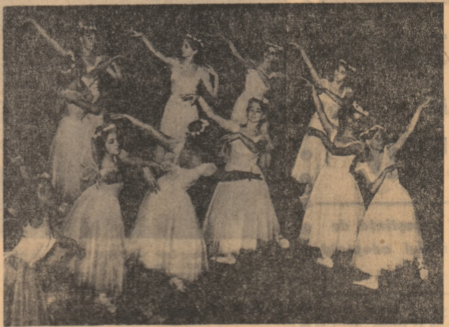
Final din tabloul coregrafic „Vizual unei nopți de cară”.