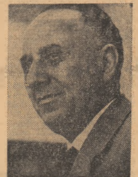
moșera adunărilor studențesci din cea mai mare școală tehnică superioară a țării: „Era firesc ca studenții să primească cu

a eforturilor pe care le fac la învățatură și întreaga lor activitate. Atmosfera de înaltă responsabilitate pe care am întâlnit-o în aceste zile în facultăți, ne îndreptățește să afirmăm că studenții sînt hotărîți să se dedice cu și mai multă pasiune învățaturii, să valorifice studenția la maximum, ca o etapă multumită în mod deosebit faptul că în cercetarea științifică vor putea ajunge oamenii cei mai înzestrați, plecînd chiar de pe băncile facultății, fără o perioadă de tranziție în producție. Sigur, aceasta creează obligații în plus profesorilor și studenților. În facultăți trebuie să sponsoare preocuparea pentru viața științifică a studenților, učenicia lor în cercetare să se facă cu mult temel în cercurile științifice și pe lângă cadetere. Avem experiență în acest domeniu, dar va trebui să reconsiderăm activitatea cercurilor științifice studențesci, în așa fel, încît ele să devină cu adevărat școli ale cercetării științifice pentru studenți.