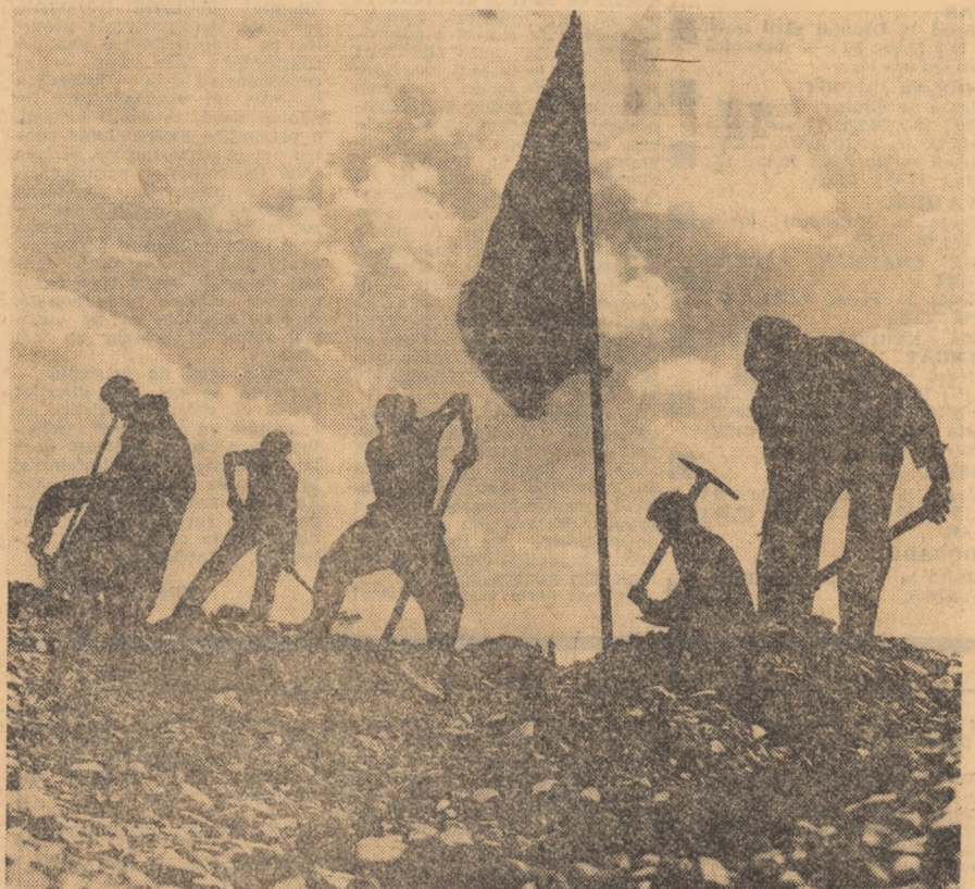
Aici, rîvnit de toți, filiiie, între noi, steagul

Momentul impune o privire retrospectivă, o evaluare matematică a roadelor acestei perioade în care aici, la Cimpina și Comarnic, 100 de tineri s-au aflat pentru prima dată față în față cu marea răspundere a muncii efective. Pe unde au trecut în cele 14 zile, ei au lăsat în zidul drumului aflat în construcție urmele adîncii ale eforturilor lor deopotrivă dăruite în lăruin bratelor vigoase și a inimilor tinere. Au lucrat la finisarea taluzelor și a platformelor terasamentelor, la executarea șanțurilor în lăngimea drumului, a betonanelor pentru epurarea mizeriilor și a zidurilor de sprijin. La diverse alte lucrări care vor rămîne încorporate într-o operă de durată. O dată cu fiecare tăbătură de fierășcop în stîncă, temerarii constructori încercaseră în straturile de bazalt un strop din energia și entuziasmul lor, din dorința lor implinită. Sub ra-