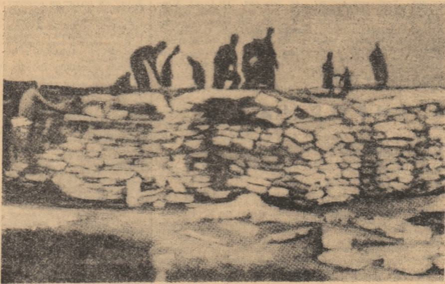
Aspect de la evacuarea bazei Khe Shan. Militari americani demolind întăririle fostelor fortificații.