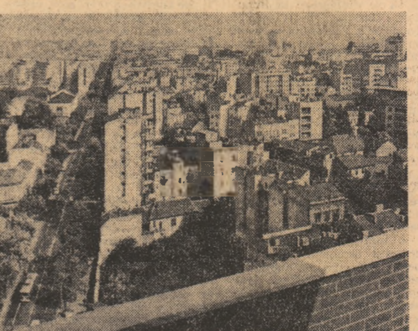
R.S.F. Iugoslavia: Imagine din Belgrad.

rirea” pentru a aduce poliția pe o pistă falsă. Mesaje radio misterioase Mai multe zăure americane au publicat măturile citorva studenți de poliție și a unui agent din Memphis, din care rezultă că în ziua asasinării pastorului King au fost interceptate o serie de mesaje radio care simulau o urmărire a asasinului de către poliție. Acesta a devenit evident că scopul acestor mesaje era de a distra atenția poliției din Memphis de la adevăratele