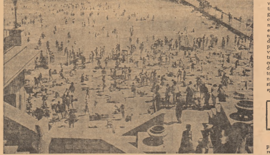
Pe plaja de la Eforie Nord