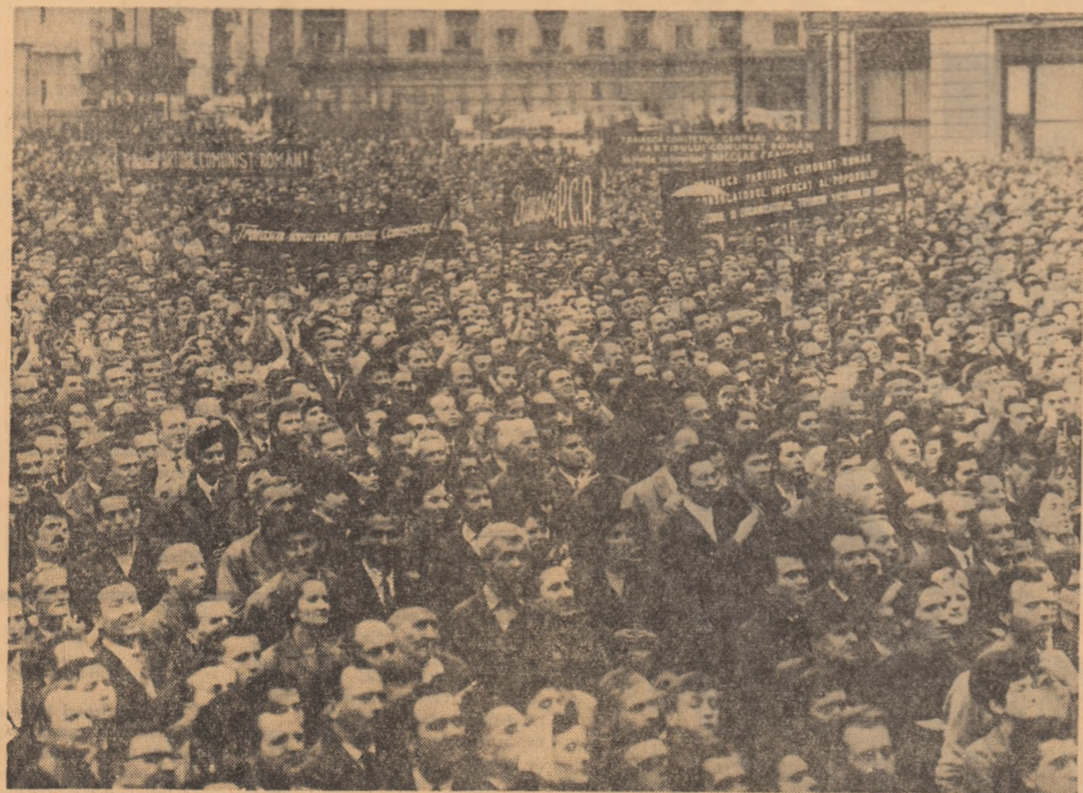
București, 21 august: pe chipurile oamenilor se citește adevărată și deplină față de poziția partidului și statului nostru

satisfacție din cuvintele tovarășului Nicolae Ceaușescu, despre hotărîrile adoptate de conducerea noastră de partid și de stat, deplin încredințat că ele reprezintă voința unanimă a întregului nostru popor. Știu că fiecare cetățean român, la locul său de activitate, trebuie să-și încească eforturile pentru îndeplinirea programului partidului, pe drumul propășirii României socialiste, că trebuie să fim tari. Tot ceea ce imi revine mie să fac, voi face în mod exemplar.