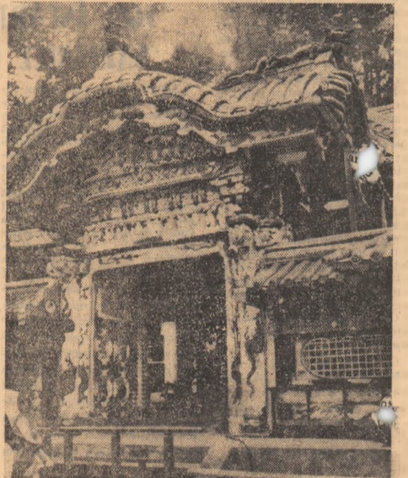
Templul din Niko (fragment)

— Pe lîngă ecoul pe care l-a avut vizita pe plan uman, prin