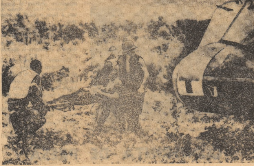
Subunitate americană evacuuind și răniții după un atac al patrioților sud-vietnamezi

tr-adevăr, o soluție pașnică și o-nobilă a problemei vietnameze, a subînțeles el, ele trebuie să renunțe la politica lor de agresiune la fașle lor neocolonialiste în Vietnamul de sud și la scopurile lor de a perpetua diviziunea Vietnamului; ele trebuie să recunoască Frontul de Eliberare Națională din Vietnamul de sud și să discute cu reprezentanții Frontului asupra chestiunilor referitoare la cele două părți în Vietnamul de sud. În primul rând, cele două părți trebuie să înceteze imediat și necondiționat bombardamentele și toate celelalte acte de război pe ansamblul teritoriului R. D. Vietnam pentru a se lua în discuție alte chestiuni interesante cele două părți. Astfel, a conchis Xuan Thuy, aceste convorbiri de la Paris vor sămne mai departe în impas și partea americană ca trebuie să-și asume întreaga răspundere pentru aceasta”.