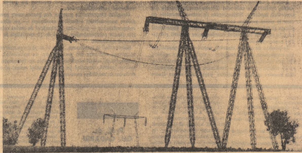
„Brazi” de metal... în peisajul județului Vișeu