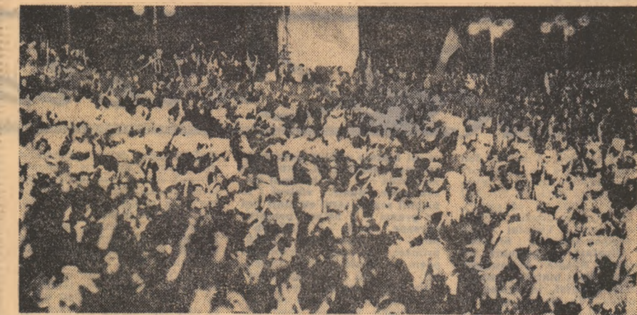
Clips de adevărat entuziasm tineresc la întâlnirea brigadierilor cu conducătorii de partid și de stat

Simplu adevăr: faptul că în socialism munca este o datorie de onoare, iar remunerarea se face potrivit cantității și calității muncii depuse. Cu toate acestea întâlnim deseori destui oameni care trăiesc de pe urma afacerilor ilicite, care cer de la societate „înțelegeră” fără să