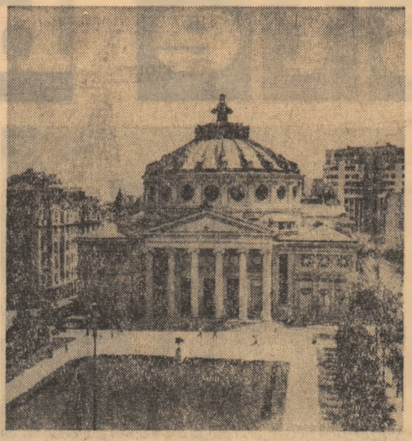
Ateneul român care în aceste zile găzduiește Centenarul Filarmonei