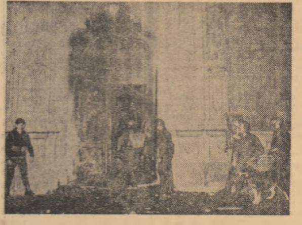
Imagine din timpul incidentelor pe care le cunoaște în ultimele săptămâni capitala mexicană

Miercuri seara în orașul Ciudad de Mexico s-au produs nouă incidente între studenți și unități ale poliției și armatei.