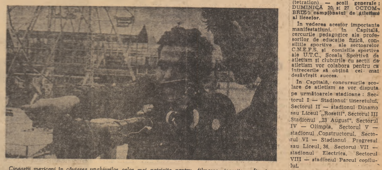
Cinești mexicani în căutarea unghiurilor celor mai patriotice pentru filmarea jocurilor olimpice

noi venează pe Eminescu, Caragiale, Rebreanu, Ibsen și pe Blaga și Ion Barbu, dezbătând cu interes pe Camil Petrescu, teatralizat de neori (alteori respinge) pe Arghezi, recunoaște (desecrî fără lectură) pe Ion Marin Sadoveanu, ignoră pe Anton Holban și Blecher, cunoaște puțin scrierile anelicele ale unor autori ca Mircea Eliade și Eugen Ionescu, nu înțelege de-a sa literatura literară pe G. Călinescu. Din valorile de după război, Marin Preda e unori privit, pe nedrept, cu antipatia pe care o provoacă manualele școlare, Geo Dumitrescu și Emil Botta sînt acceptați fără rezerve, Mihail Beniuc e uitat, Geo Bogza e respectat, Nichita Stănescu fascinează, de curînd Nicolae Breban și Al. Ivasiuc sînt amplu și viu discutați, o serie de critici foarte inteligente și de gust, mai bîrbași sau mai tîneri, sînt pe nedrept necitiți.