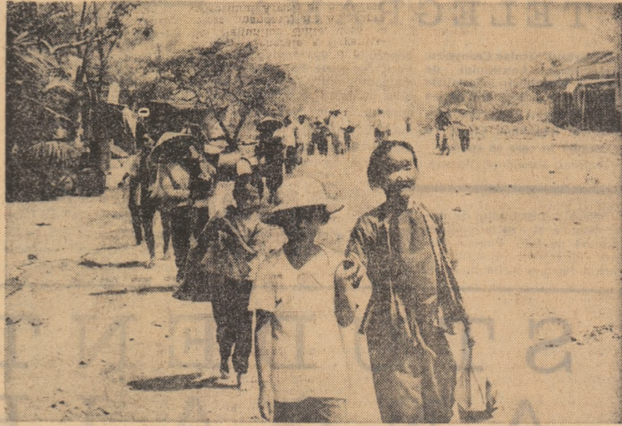
VIETNAMUL DE SUD. — Cetățeni din Cam Le luind drumul refugiuului după bombardarea satului lor de către americani.