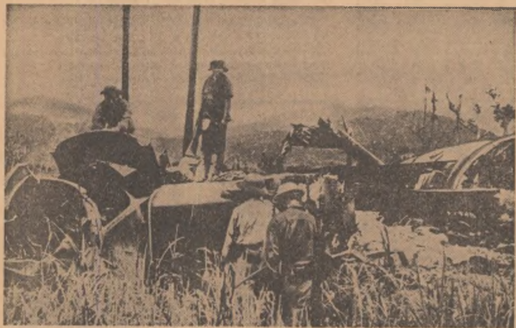
VIETNAMUL DE SUD. Elicopter aparținând trupelor intervenționiste americane doborât de patrioți