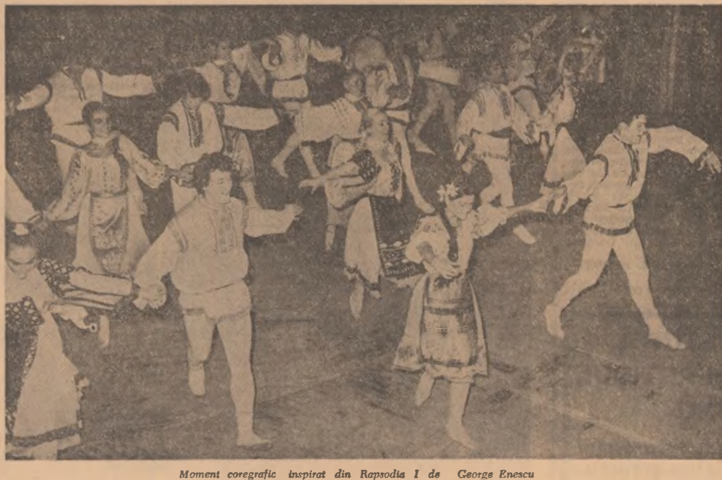
Moment coregrafic inspirat din Rapsodia I de George Enescu