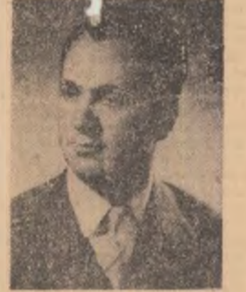
lar al orașului Sinaia. Desigur tîni dau seama că aceasta este pentru mine o mare cinste dar și o mare răspundere.

— Candidați pentru prima oră ca deputat pentru Consiliul popular