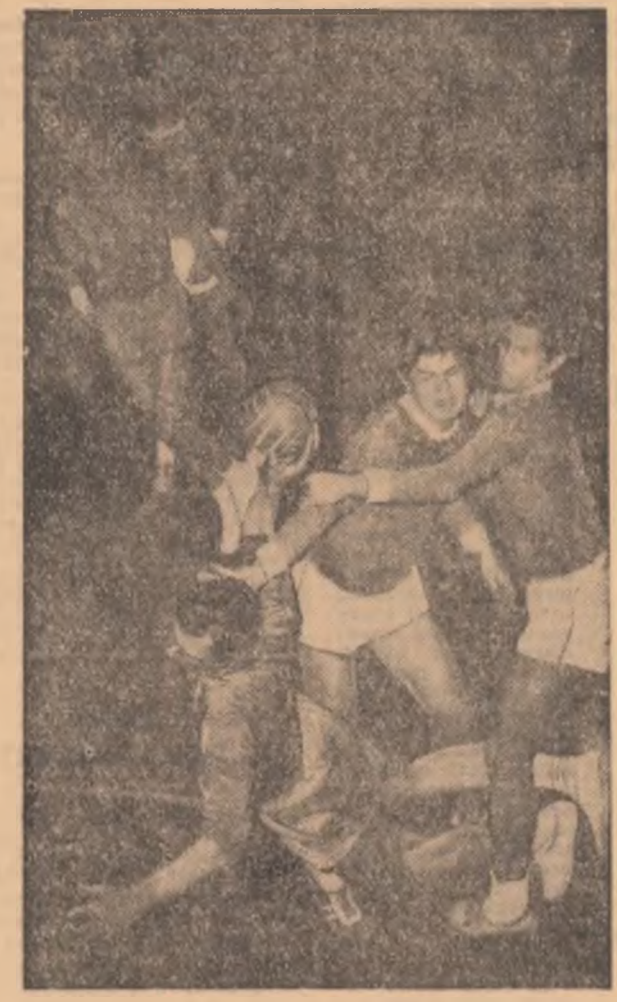
O fază dinamică