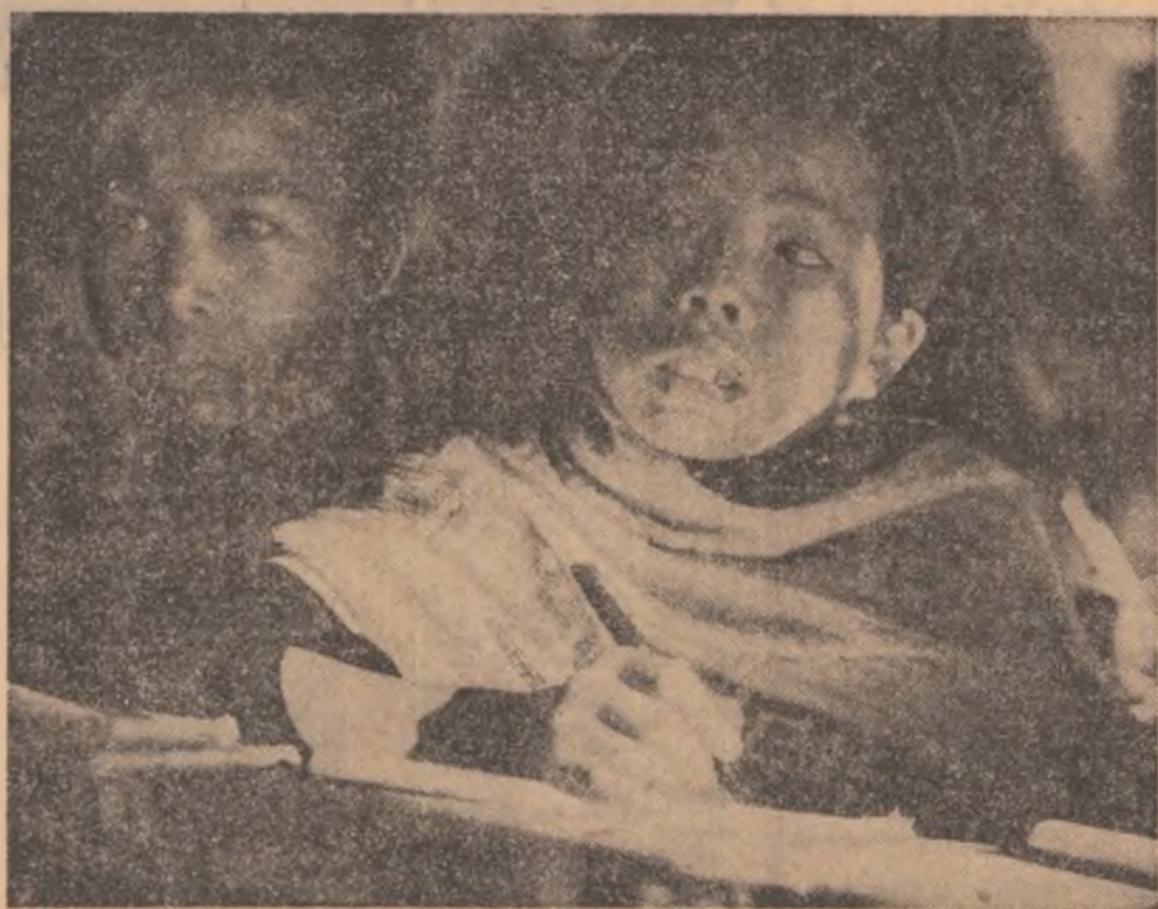
LAOS. — Copii descifrind tainele scrisului într-una din școlile provinciei Sam Neua, aflați sub controlul forțelor patriotice

● După cum anunță agenția France Presse, surse informate ale O.N.U. au comunicat că Gunnar Jarring, reprezentantul secretarului general, U Thant, în Orientul Apropiat, va sosi săptămîna viitoare la New York. Cu acest prilej, el va stabili contacte cu cei patru membri permanenți ai Consiliului de Securitate.