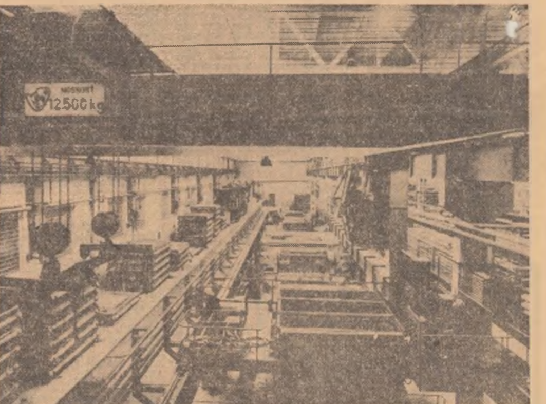
R. S. Cehoslovaca. — Imagine de la fabrica de panouri din Vintirov (Boemia de vest)