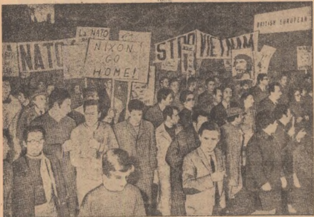
ITALIA. — In timpul recentelor manifestatii de la Roma, prilejuita de vizita președintelui Nixon