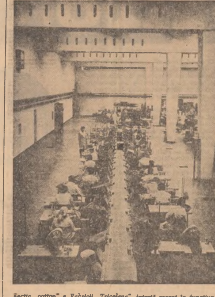
Becia „cotton” a Fabricii „Tricolorana”, intrată recent în funcțiune