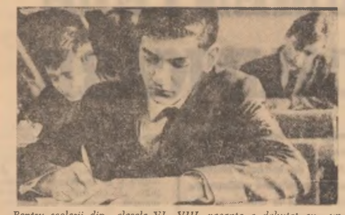
Pebru scolarii din clasele VI-VIII, vacanta a debutat cu un concurs: Traditionala OLIMPIADA DE MATEMATICA, care a intrunit in competitie mii si mii de elevi din toata tara.