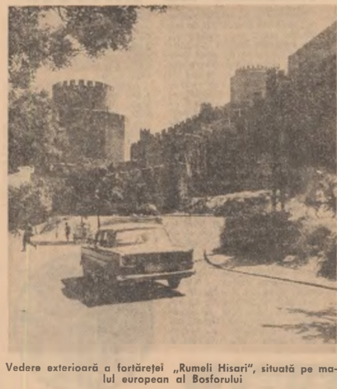
Vedere exterioră a fortăreței „Rumeli Hisari”, situată pe malul european al Bosforului

Trecerea din istorie în prezent se face fără nicio ostenție — vizitatorii. Pe lespezile lor se desfășoară reprezentații de teatru în aer liber, iar în zilele de sîrbătoare „Mehter” (fanfara militară) oferă concerte publice. Trecerea din istorie în prezent se face fără nicio ostenție — vizitatorii. Pe lespezile lor se desfășoară reprezentații de teatru în aer liber, iar în zilele de sîrbătoare „Mehter” (fanfara militară) oferă concerte publice.