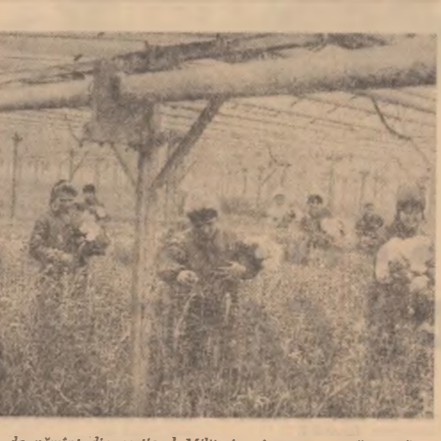
Încă de anul trecut pe o mică întindere de pământ din cartierul Militari s în permanență cară. Aici cresc mereu diferite soiuri de gârsoaie, frezie, gura leului, asparagus. Nu este o minune a naturii, ci este o nouă secție a marii uzine de flori întreprinderii Horticolă 1 Mai din Capitală.

stutului politehnic a adus pe scenă reale talente interpretative. Sala de fiecare dată plină până la refuz, s-a dovedit a fi un critic sever chiar înaltele iurului care în urma celor 10 zile de întrereri, va trebui să decidă asupra laureatilor.