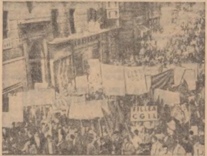
Aspect de la demonstrația desfășurată la Palermo în timpul grevei muncitorilor zilieri din Sicilia

Ziarele menționate au publicat fotografia președintelui Consiliului de Stat al României. Televiziunea turcă a prezentat simbatic seara un film documentar despre țara noastră.