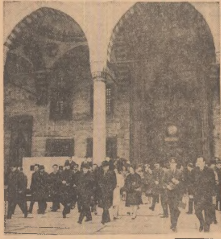
La ieșirea din monumentală clădire a „Sfintei Sofii”