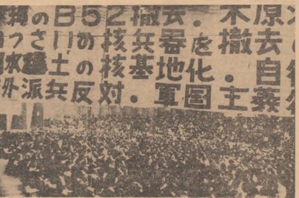
JAPONIA. — În orașul Shizuoka a avut loc recent un miting împotriva înarmărilor nucleare. În imagine, aspect de la miting

HANOI 30 (Agerpres). — Ministerul Afacerilor Externe al R. D. Vietnam a dat publicității o declarație în care se arată că Statele Unite intensifică atacurile aeriene asupra Cambodgiei. Pe de altă parte, se arată în declarație, S.U.A. inventează diferite versiuni cu privire la existența unor baze ale trupelor nord-vietnameze în Cambodgia, pentru a pregăti opinia publică în vederea unei eventuale extinderi a ostilităților în această țară.