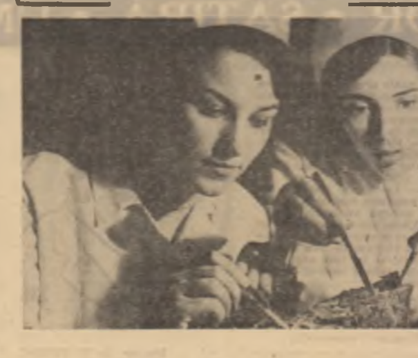
Oul prezintă cu studenții eroii I naturii de la Institutul de Medicină și Farmacie din Capitală