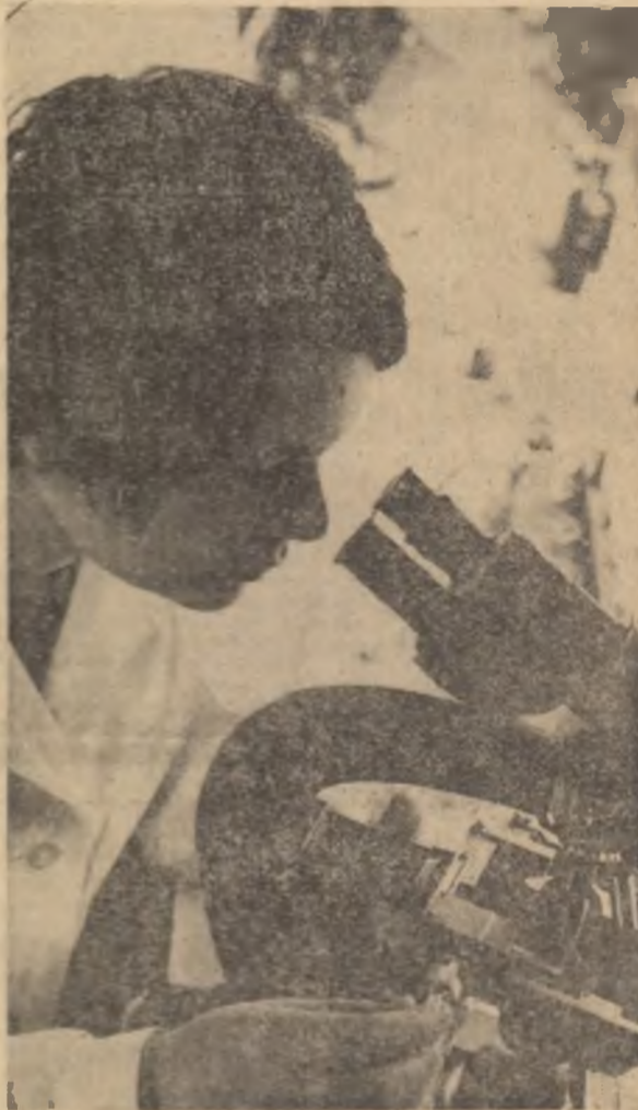
In lumea incertabilului... (Efectuarea unei analize in laboratorul de citologie a Institutului agronomic din Timisoara)

„Reabilitarea unui haicuc” de Mihai Stoian, carte publicată mai întâi în foliolele de către „Știința tineretului” și mai apoi de către o editură de tineret, nu e doar o lectură pasionantă, ci o reabilitare — cu superioare mijloace — a unui gen de literatură de factură sociologică, pornind de la cercetarea unor izvoare documentare sigure și refuzându-și ficțiunea.