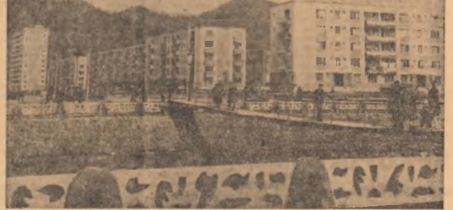
In cartierul Sîsar din Bala Mare

intreaga capacitate de inteligență tehnică pe care o posedă. Chiar în cadrul activității de proiectare, cercetare și dezvoltare din uzinele „Autobuzul” și „Hidromecanica” s-a demonstrat că în decursul unei zile obișnuite de muncă partea de nivel ingineresc superior, adică conform calificării lor, se ridică la abilitățile necesare pentru proiectarea și dezvoltarea de produse tehnice. Semnalăm însă că inginerii integrați funcției de „management” de cadru, cu greu pot face față cerințelor complexe ale acestui concept în activitatea lor profesională, datorită golurilor existente în pregătirea lor pe linia cunoștințelor de psihologie, economie, etc. De unde decurge că pentru un