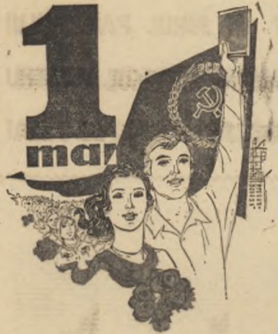
Desen de NICHIE POPESCU