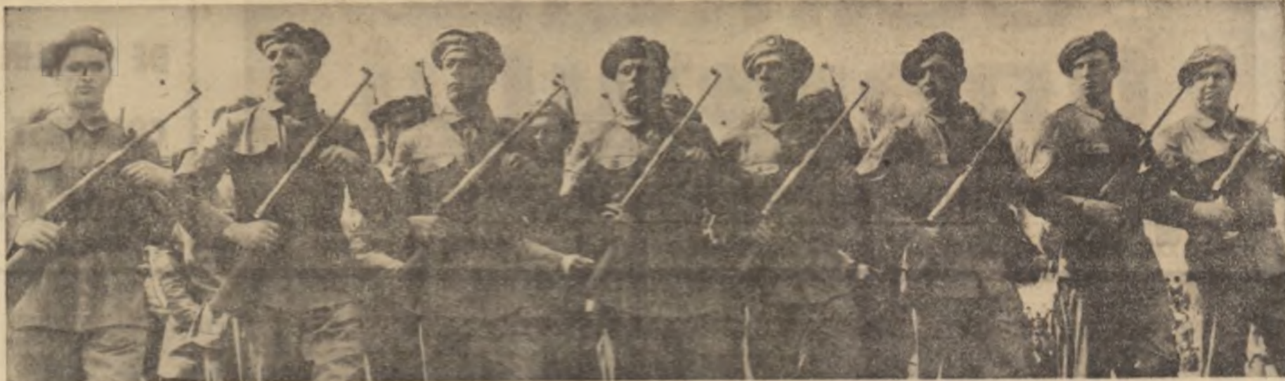
Un moment garzilor patriotice — paradă a cadavrelor revoluționare ale poporului