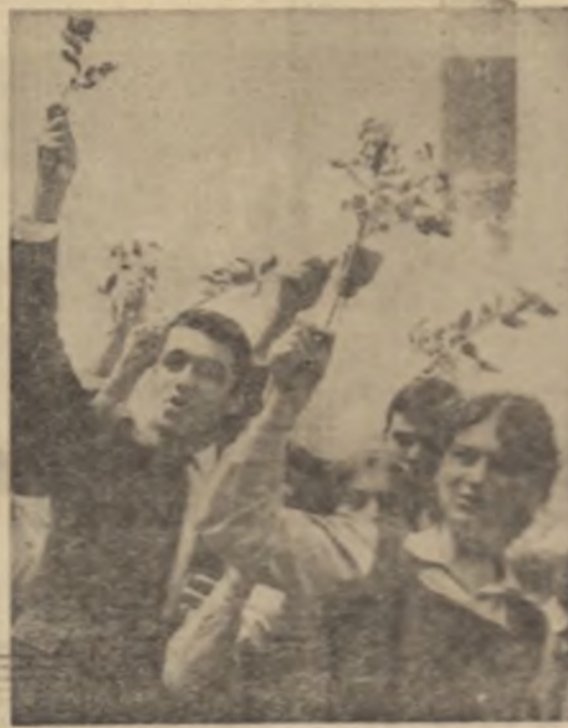
O imagine plăcută pentru studenții cu care s-a prezentat la marș demonstrație, alături de întregul popor, înarmată marș al țării

După explozia de exuberanță a vârstii cravatei roșii, ca o simbolică trecere a viitorului patriei pătrund în piață, în bloc compact, într-o dinamică riguroasă cadentă, garzile patriotice, înarmate. Oamenii de diferite vârste și profesii, a căror prezență cotidiană e lângă străng sau în fântâ-