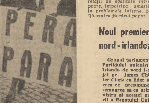
Grupul parlamentar al Partidului unionist din Irlanda de nord...