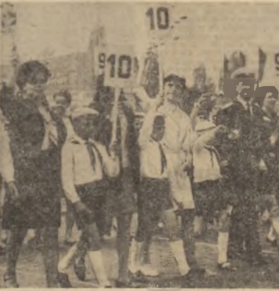
La marea demonstrație sint prezenți — alături de fiii lor, membri ai organizației de pionieri — și mulți dintre cei care, cu două decenți în urmă, au fost primii care și-au pus cravata roșie de pionier

I-am văzut, în această zi, pe oamenii muncii, saluțind cu ovații pe conducătorii de partid și de stat, scandând cu înflăcărate numele Partidului Comunist Român, al secretarului general al Comitetului Central. De la tribuna, tovarășul Nicolae Ceaușescu le răspunde cu căldură, în timp ce noi valuri de entuziasm inundă piața: „Ceaușescu și poporul!” „Ceaușescu — P.C.R.!” scandează mii de glasuri unite. Ca în altele alte rinduri, înțelina dintre conducătorii și masa de oameni ai muncii emblematice prin spontaneitatea și căldura ei, care exprimă unitatea deplină dintre partid, guvern și popor, încrederea de nezdărnicat a oamenilor muncii din România în conducătorii destinelor lor.