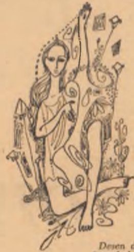
Desen de IOV MARIA Liceul de arte plastice

II În nopți și zile picurii s-au strîns În ulciorul lutului ascuns