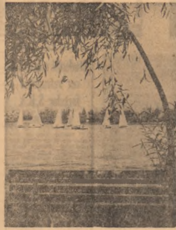
Cu yolele pe lac