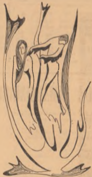
Desen de ELENA CARMEN CULA Liceul de arte plastice