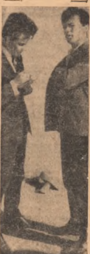
Dialog dificil. Într-adevăr, e dificil să motivezi de ce absentezi cînd n-ai nici un argument la îndemînă.

Alții sînt mai grăbiți. Nu încep lucrul mai devreme; îl termină, în schimb, mai de timpuriu.