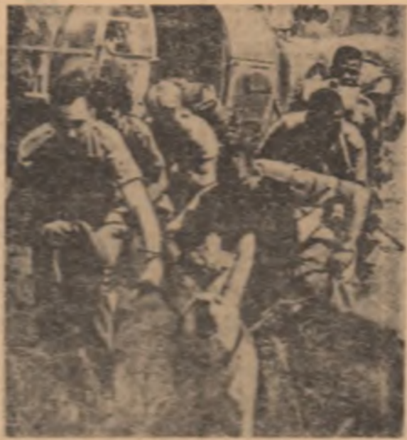
Falciți sud-estici în timpul unei sesiuni de lucru și discuții cu personalul din Namibia (Africa de sud-vest)

El s-a referit la activitatea născută la desfășurată de Comitetul Consultativ al O.N.U. pentru aplicarea științei și tehnicii în folosul dezvoltării, pentru găsirea căilor și mijloacelor adecvate prin care O.N.U. ar putea să intensifice cooperarea internațională în acest