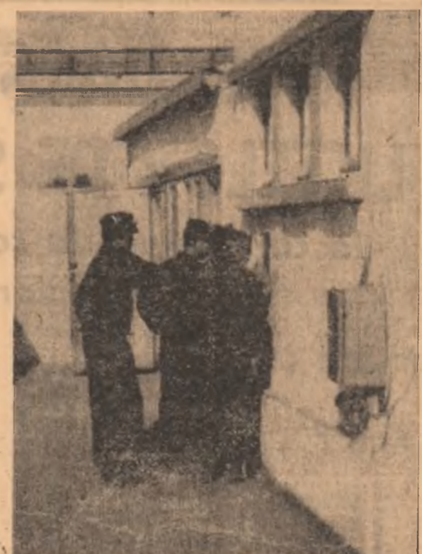
Nu. Nu e pauza regulamentară, așa cum ar putea să sugereze această imagine. De fapt, fotoreporterul a surprins una din modalitățile de intrare a timpului de lucru.