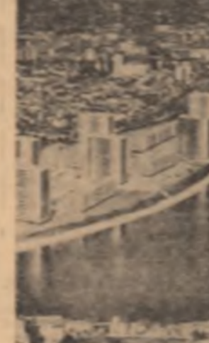
FRANȚA. Vedere din orșul Tours

În declarațiile făcute în diverse localități din periferia pariziană la sfîrșitul săptămîinii trecute, Georges Pompidou a căutat să scoată în evidență pericolul pe care îl reprezintă revenirea la situația celei de-a IV-a republici în cazul alegerii lui Poher, adică la instabilitatea politică. Totodată el a dat asigurări diverselor categorii sociale, în special comercianților și micilor meșteșugari, că va ușura situația lor fiscală.