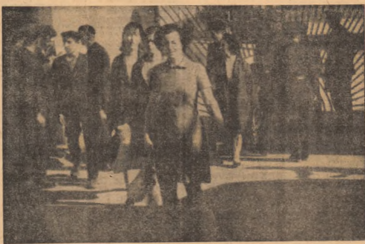
Și în această dimineață un număr destul de mare de tineri încep lucrul cu întârziere. Din păcate, această imagine se înfășește prea des, după începerea programului, la poarta șantierului.