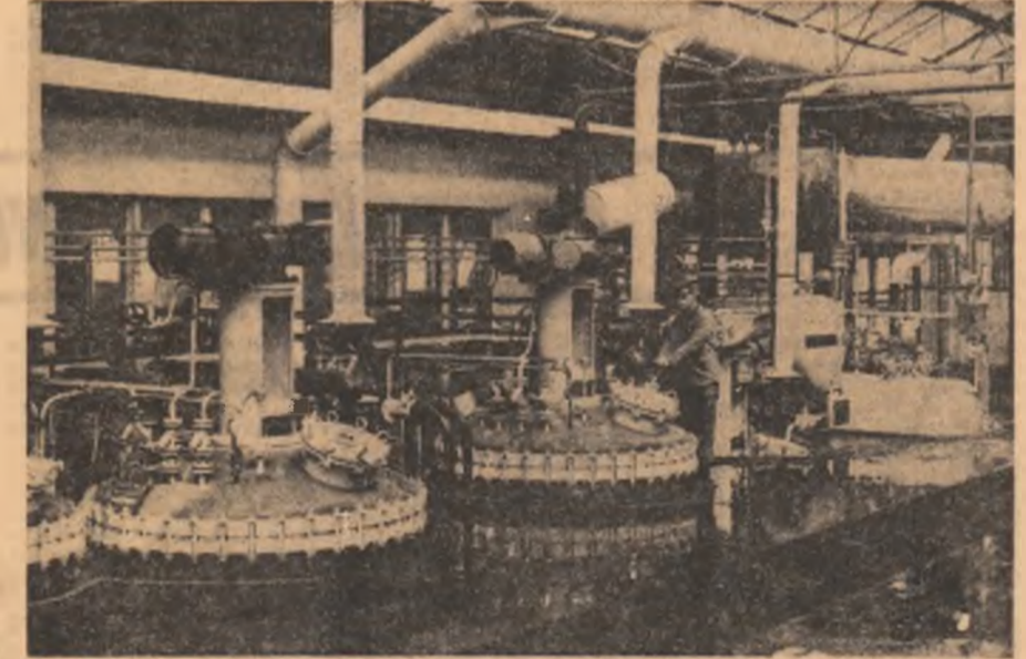
R. S. F. IUGOSLAVIA. Uzina de produse farmaceutice și chimice din Zagreb

Referindu-se la aceste acorduri, ziarul „WASHINGTON POST” reamintește faptul că cereri tot mai largi ale opiniei publice americane și reprezentanții ai Congresului contestă necesitatea menținerii bazelor americane din Spania, cerînd desființarea lor.