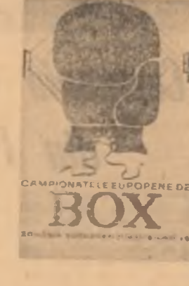
COMPANIILE EUROPE DE BOX

5-1 e un scor dulce. Luînd făcîl în serios, corsarii din Ștefan cel Mare puteau să înscrisă 9 sau 10 goluri. Dar poate că nici atunci nu m-ai fi plăcut. Cel puțin eu nu pot asista cu inima deschisă la un masacru al fluturilor. La Constanța, Farul a învins Steaua cu 3-2 și bănuiesc că nici zeul mărilor și nici tritonii din suita lui nu cred că la București au putea să-și mențină avantajul. Sint convins că finala Cupei României se va disputa între Dinamo și Steaua. Și,u, mîngear a rotundă, dar la București se capătă colți și ghimpi. Și sint mulți aceia care și-au atîngat palmele în. Notez că n-am auzit tîlăngi bătînd. În schimb — surpriză! — a explodat o petardă. Poate că la meciurile jucate în noaptea vom avea și focuri bengale. Începutul s-a făcut.