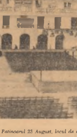
Patinoulul 23 August, locul de desfășurare a europenelor de hox