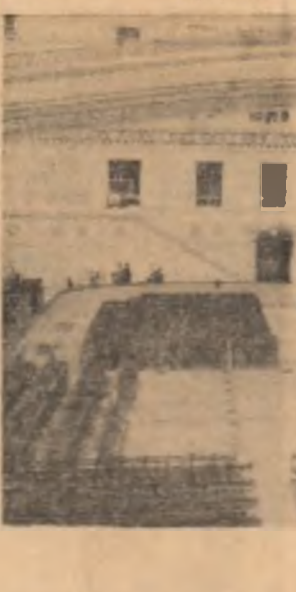
Patinoulul 23 August, locul de desfășurare a europenelor de hox

Jot, corul de copii „Zadikow” va concerta la Bacău, iar vineri și simbăia la București. (Agerpres)