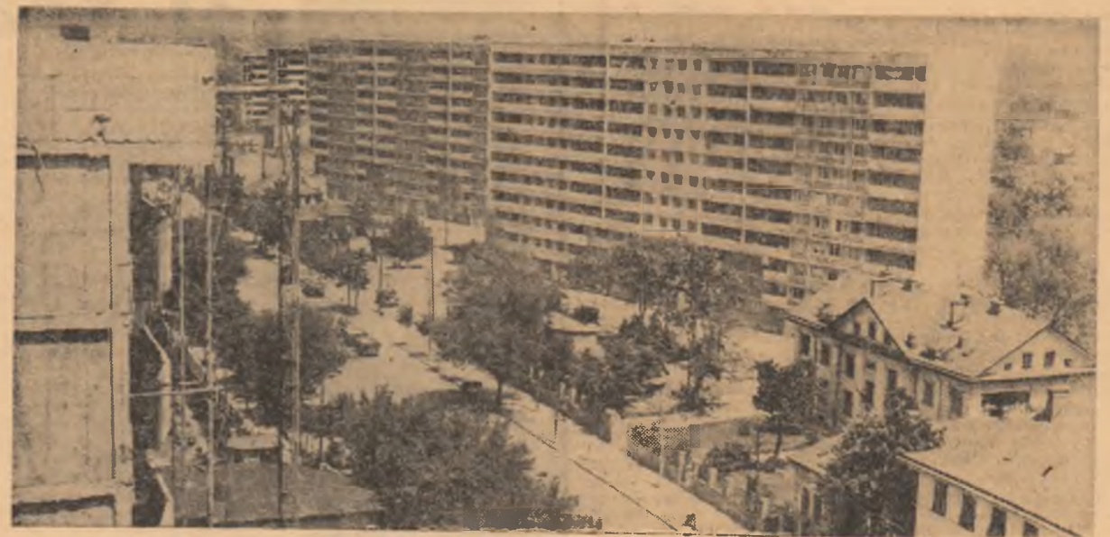
Colentina își schimbă înfățișarea cu fiecare zi...