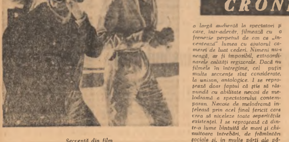
Secență din film

S-au făcut încercări de cîntare pe muzica filmului „A trăi pentru a trăi” al lui Lelouch, cu notații o parte din critica franceză care s-a autoîncredințat drept adevărată și autoritară cîntărea adevărată, pînă la a filmului pentru a fi un-a concluzivă într-o recenză critică de primă mîna. Cineva Lelouch este un reporter ale cărui filme se bucură de