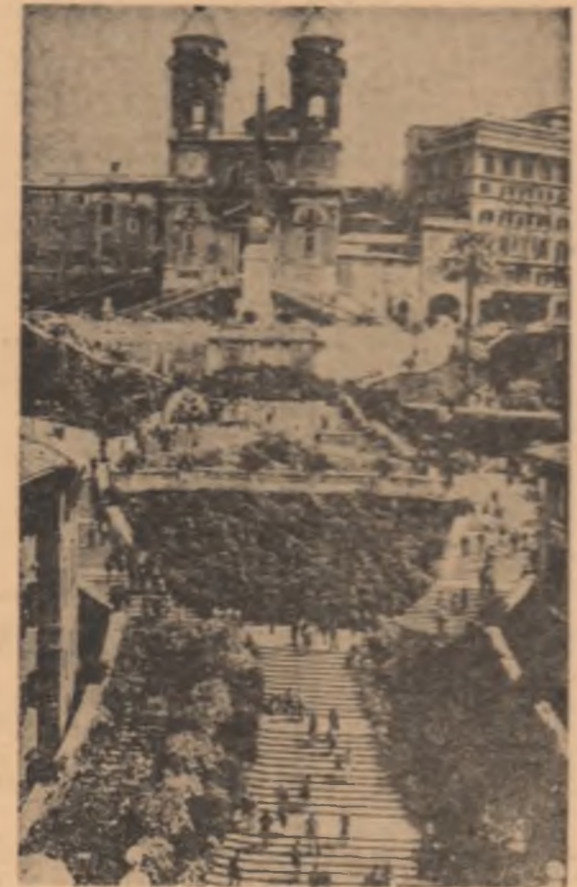
ITALIA. Renumita Piață a Spaniei din Roma

Potrivit relațiilor agenției U.P.I., Rockefeller „s-a bucurat de o primă rece” la Bogota din partea oficialităților columbiene nemulțumite de obstacolele ridicate de S.U.A. în calea exporturilor de cafea și a acordării de credite pentru satisfacerea necesităților economice ale țării. Președintele Columbiel, Carlos Lleras Restrepo, a desemnat 10 comitete speciale, fiecare condus de câte un ministru, pentru a discuta cu membrii suitei lui Rockefeller dificultățile țării sale în relație cu S.U.A. Miercuri, la Bogota s-a anunțat că pe lângă mobilizarea a 10.000 de poliști, guvernul a hotărât chemarea de urgență sub armă a unui număr de rezerviști „pentru a garanta securitatea personală” a trimisului președintelui Nixon.