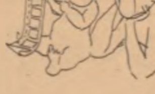
Desen de POPOSCU GOGO