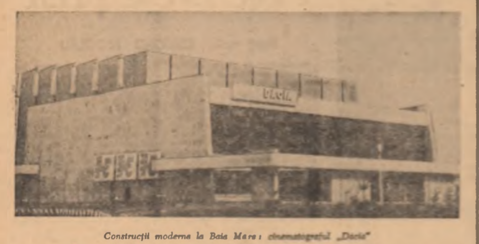
Construcții moderne la Băia Mărei: cinematograful 'Dacia'