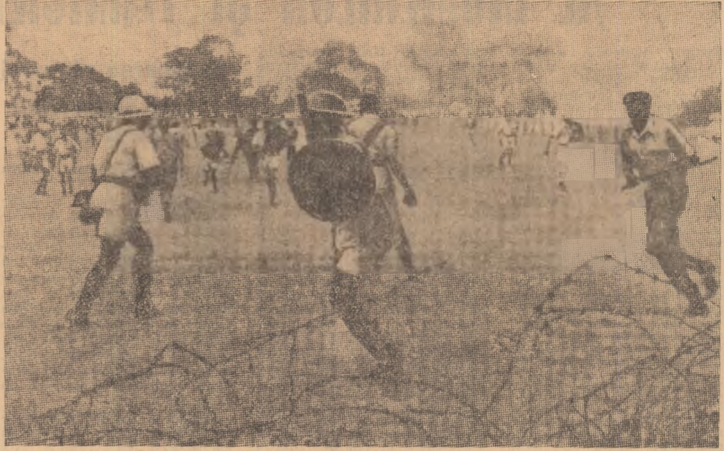
După asasinarea lui Tom Mboya, în Kenya s-au produs grave incidente. Fotografia noastră redă un aspect de la ciocnirile dintre membrii diferitelor triburi și poliție

În cadrul Întilnirii au început apoi discuțiile generale.