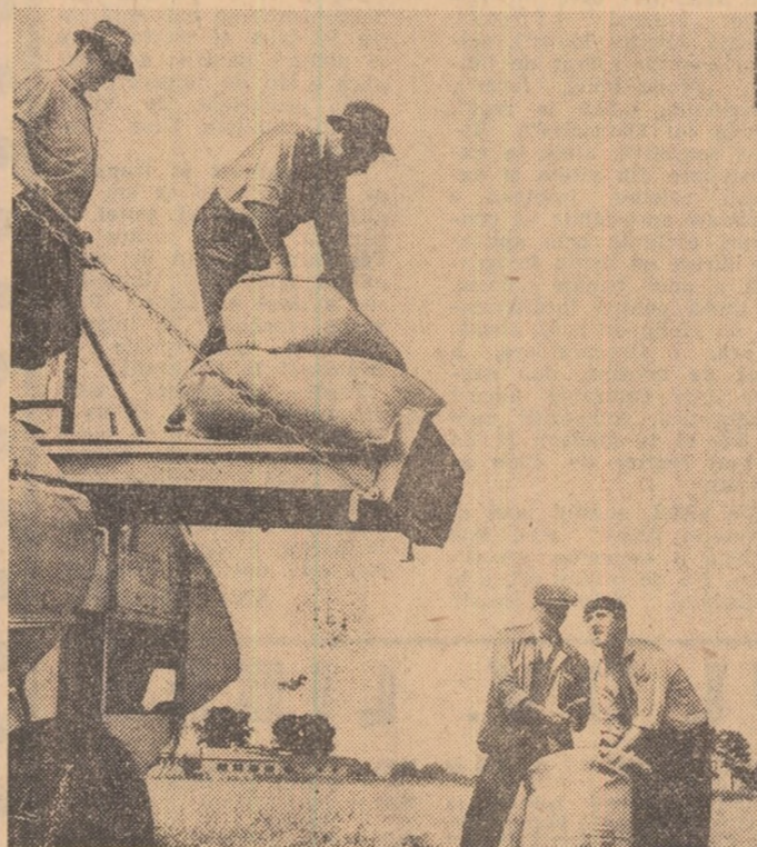
Ca urmare a activității desfășurate de mecanizatorii de la I.M.A. Ciorogirla, de pe cea mai mare parte a suprafețelor cooperatice agricole de producție din comuna Dudu-Ilfov, recolta a fost strînsă