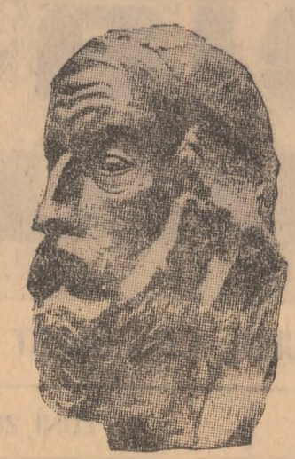
G.H. STĂNESCU: „Dostoiești cronicarul”

simbolice, dar care în acest caz sunt mai degrabă expresii ale unei sensibilități care se apropie de o anumită „simb-trinită”. Sculptorul știe să sugereze infinite nuanțe de sen-