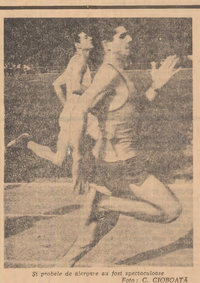
Și probele de alergare au fost spectaculoase