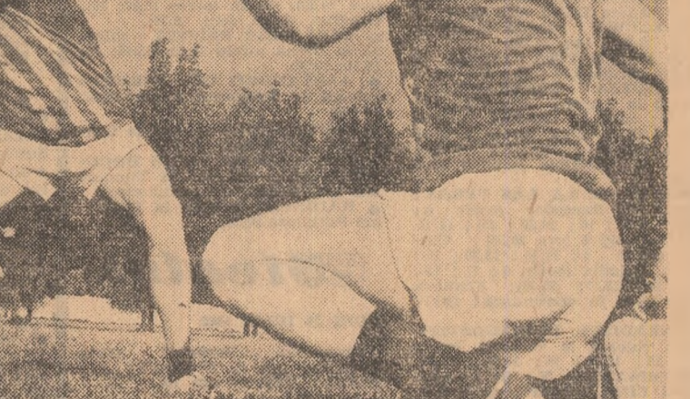
Oina — sportul nostru tradițional, a oferit dispute pasionante

Diputată în paralel pe două stadioane din Oradea — „Tineretului” și „Voința”, sîmbătă și duminică — etapa a III-a, pe județul Bihor, a Cupei tineretului de la sate a reunit la start pe cei mai buni 480 de sportivi ramași în competiție, dintr-un număr de peste 22 000 ei au participat la prima etapă, de masă. Cupele de cristal executate la renumita fabrică de sticlă Pădurea Neagră, medaliiile de aur, argint și bronz, ca și premiile în materiale sportive și alte distincții i-au răsplătit pe cei mai buni.