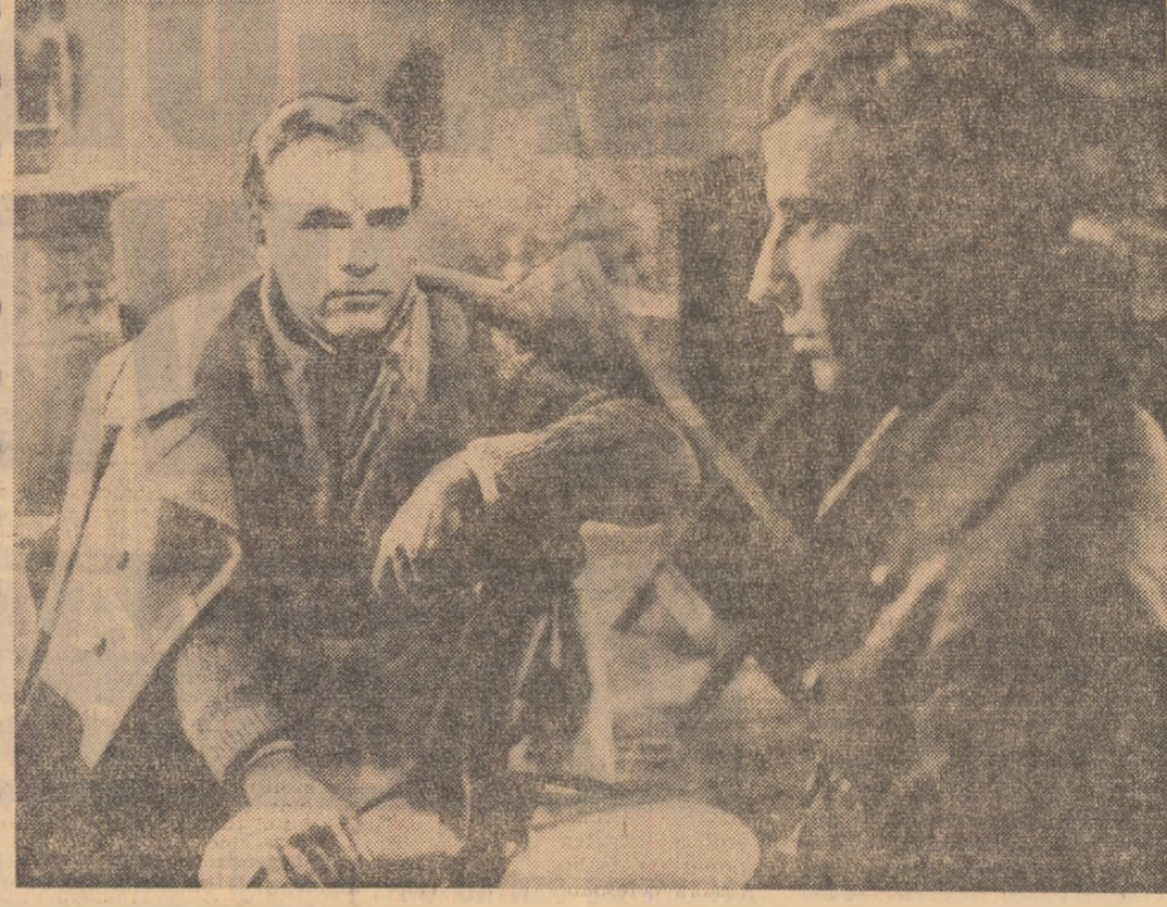
Cadru din filmul „Pădurea spînzuraților”

„Livia Ciulei rediscută destinul eroului lui Rebreanu din punct de vedere al unor oameni care trăiesc aici și acum. Perspectiva timpului a eliminat aspectele de conjunctură și a consolidat permanențele dramatice lui Bologa. Universul destinului lui Bologa, filmul devine un fel de monografie a individualismului.”