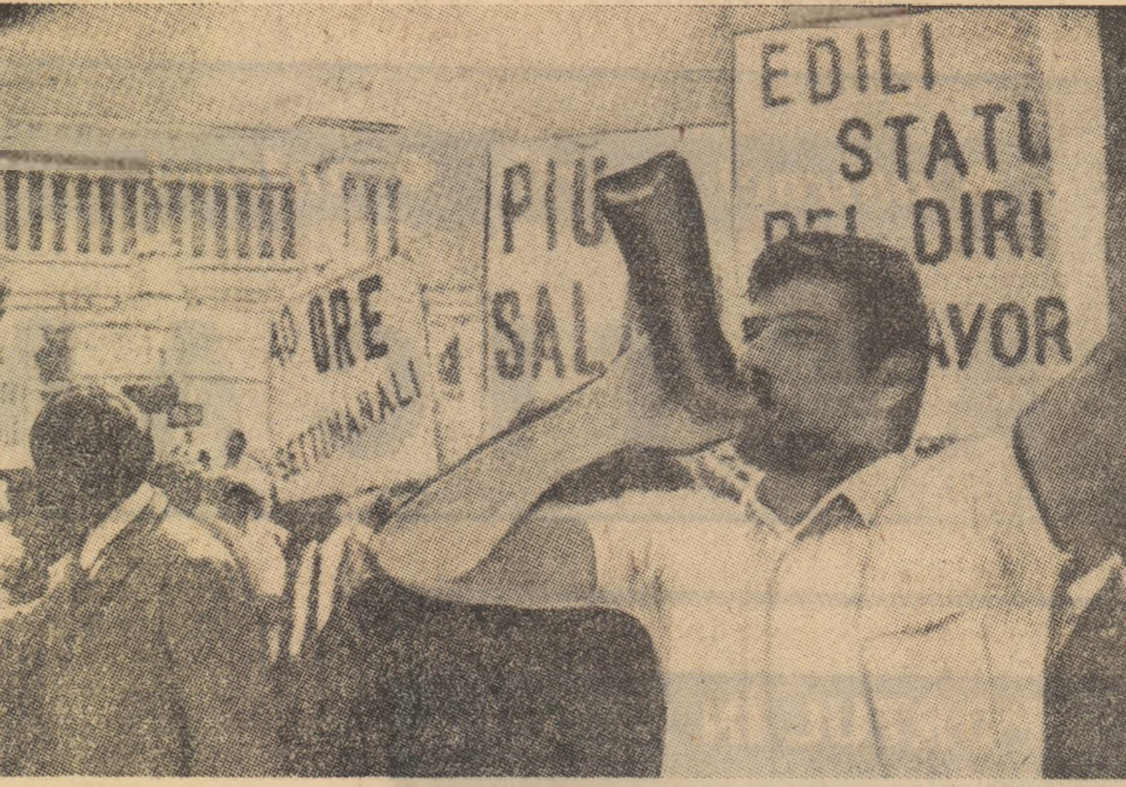
ITALIA. — Aspect din timpul unei recente demonstrații a greviștilor din Roma