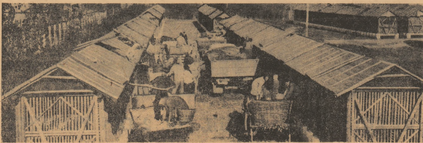
Aspect de la baza-siloș din Videle, la o oră de „virt”