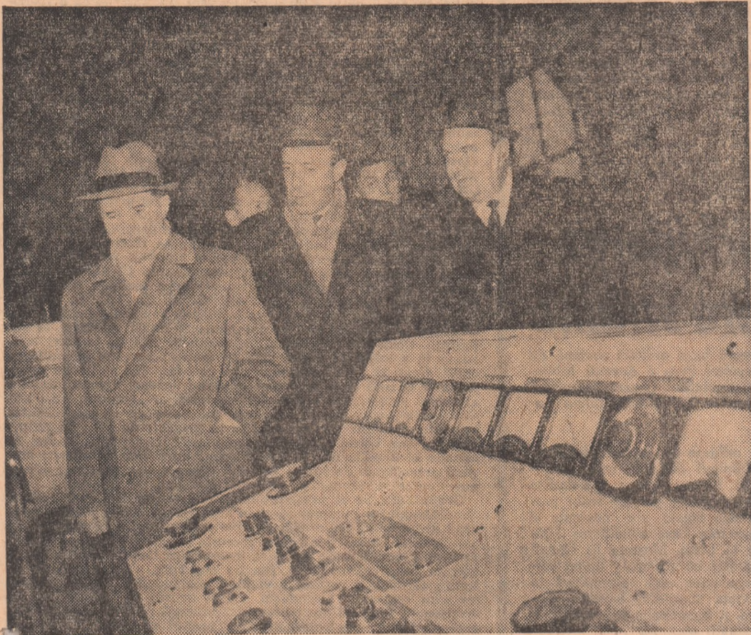
La Fabrica de cabluri și materiale electroizolante