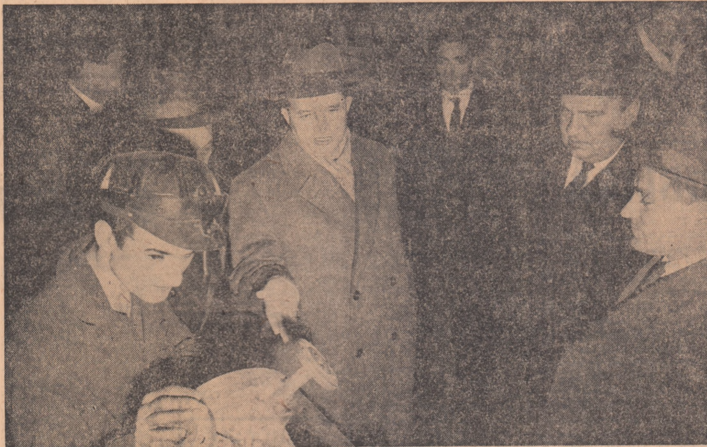
La uzina de utilaj chimic „Grivița Roșie”

Tovarășul Nicolae Ceaușescu este invitat să viziteze uzina. Pretutindeni muncitorii, tehnicienii și inginerii fac o călduroasă primire secretarului general al partidului, care fi-