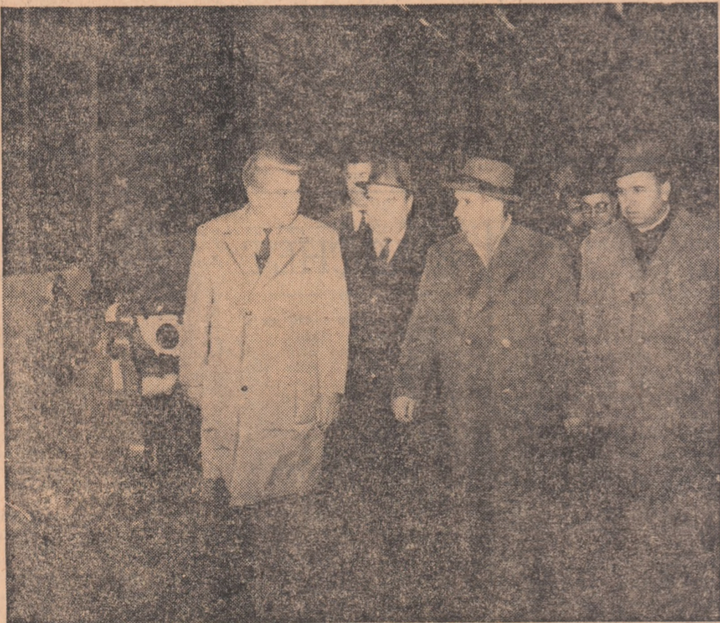
La Uzinele „23 August”