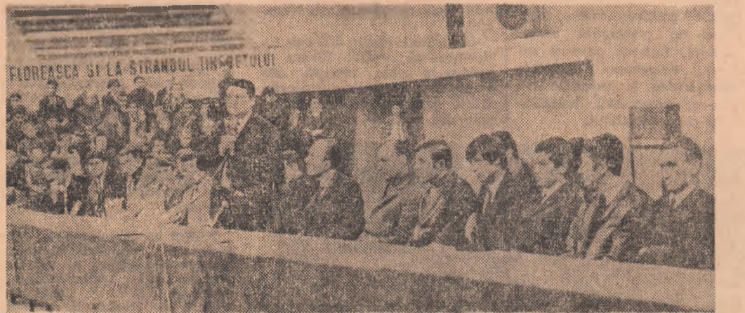
Această imagine-document, reprezentînd componenții lotului național înaintea marilor ofensive organizate de ziarul nostru între „tricolorii” și suporterii, la începutul lui '69, Atunci a încoțit ideea clubului suporterilor echipei naționale de fotbal.

Firesc, noi, studenții, sîntem primii care ne manifestăm opțiunea pentru a deveni membri ai clubului: se știe, galeriile studențesci sînt teribile.