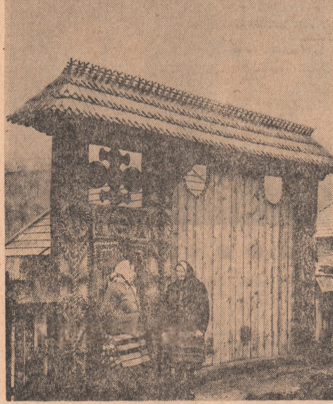
O măiestrită poartă din comuna Vadul Izei, jud. Maramureș

Interviuri realizate de SMARANDA JELESCU