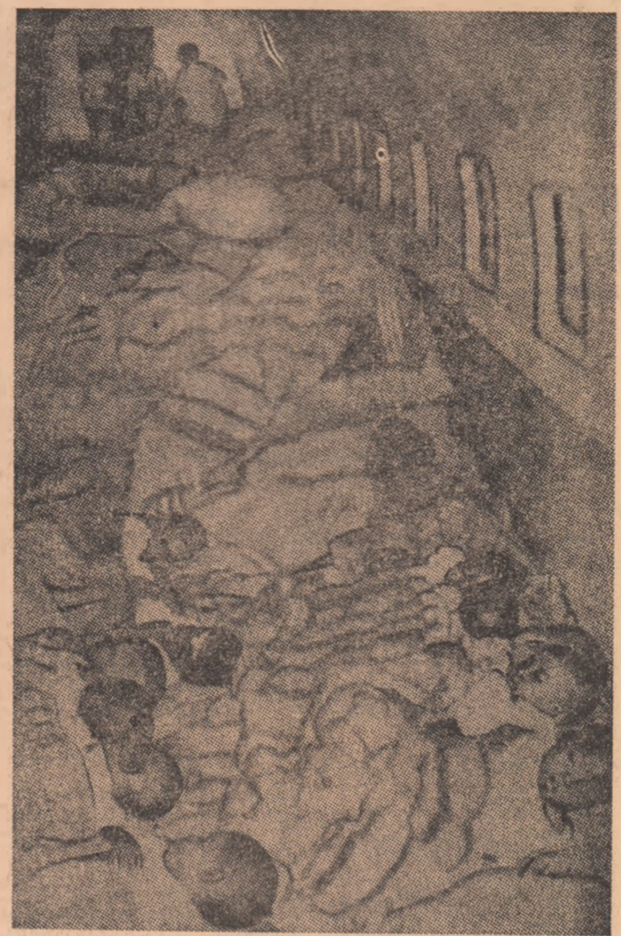
Copii biazrezi transportați pe calea aerului în țările africane vecine pentru a fi salvați de consecințele acțiunilor militare din ultima fază a conflictului

Generalul Philip Effiong a declarat că, inițial, Biafra a recurs la lupta armată din cauza sentimentului de insecuritate generat de evenimentele din 1966 — când a avut