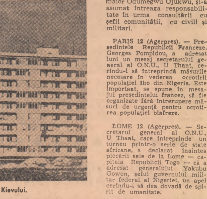
U.R.S.S. Aspect din unul din noile cartiere ale Kievului.

Generalul Philip Effiong a declarat că, inițial, Biafra a recurs la lupta armată din cauza sentimentului de insecuritate generat de evenimentele din 1966 — când a avut