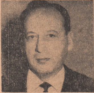
antrenorul federal ANGELO NICULESCU

Anunțăm cititorii noștri că VINERI, 16 IANUARIE, LA ORELE 16,00, ÎN SALA SPORTURILOR FLOREASCA, ziarul „Scînteia tineretului”, în colaborare cu Federația română de fotbal, organizează o nouă întîlnire cu componenții lotului național de fotbal. Cu prilejul acestei reuniuni se va constitui Clubul suporturilor echipei naționale de fotbal. Spicium câteva dintre punctele „forte” ale evenimentului: • CEI prezenți vor asista la semnarea actului de constituire de către membrii fondatori ai clubului. • ANGELO NICULESCU, antrenorul echipei naționale, va face pentru cei prezenți o incursiune în programul de pregătire a „tricolorilor” pentru asprele bătălii ce se anunță pe platourile mexicane. • CRAINICUL televiziunii, Cristian Țopescu, va lua cîteva interviuri-blitz „tricolorilor” și unor invitați la festivitate. • CRONICARII de fotbal în postură de... interlocutori într-o cursă de pronosticuri pentru Turneul final al C.M. din Mexic. Deocamdată, ați! Mîine divulgăm și alte „secrete”. În orice caz anunțăm amatorii că înfîlîirea mai rezervă și alte puncte de atracție și pe portativul fotbalului, dar mai ales pe cel al muzicii!