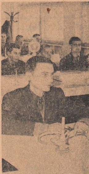
În laboratorul de chimie a Grupului școlar de petrol Moinesti