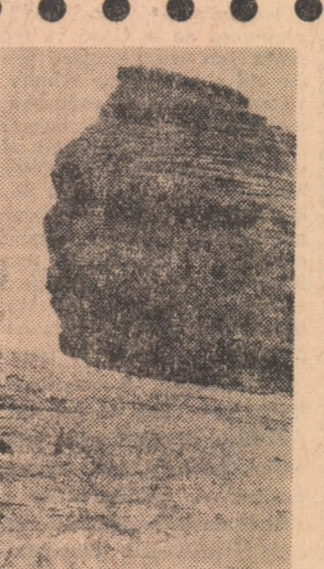
„Sînxul” din Bucegi.

Se vorbește mult că astăzi, față de trecut, este nevoie de jucători pregătiți multilateral, adică de „jucători compleți”.