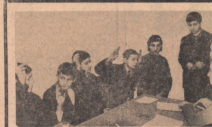
Ridicările de mîni marchează importanța momentului: începînd din clipa aceasta, ai devenit utecit.

Leul de piatră are numai patruzeci de ani. În anul 1929 la 29 iunie a fost inaugurat „ca omagiu adus eroi- (Continuare în pag. a IV-a)