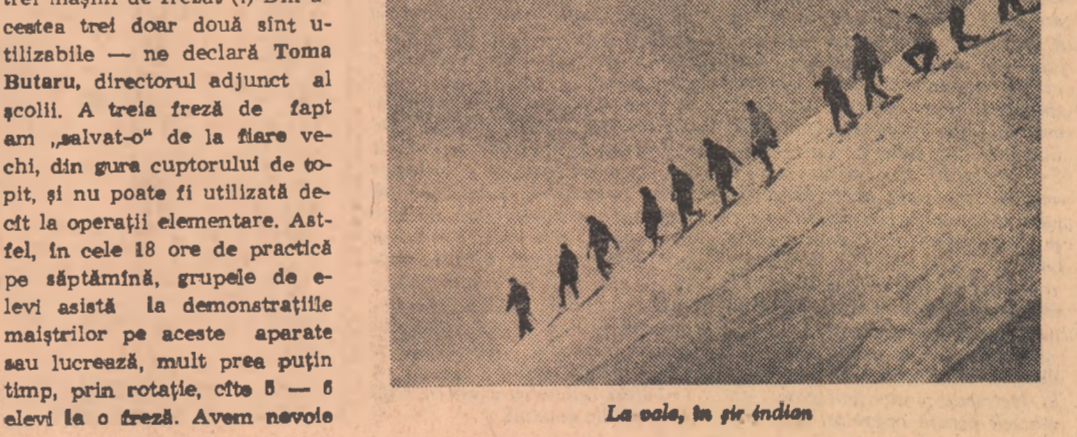
La oală, în șir indian