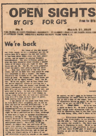
Facsimil din OPEN SIGHTS: „un simptom al creșterii antimilitarismului”

publicațiile tinerilor militari protestatari care, toate, poartă alături de titlu inscripția sugestivă: „scris de soldați pentru soldați” își continuă apariția,