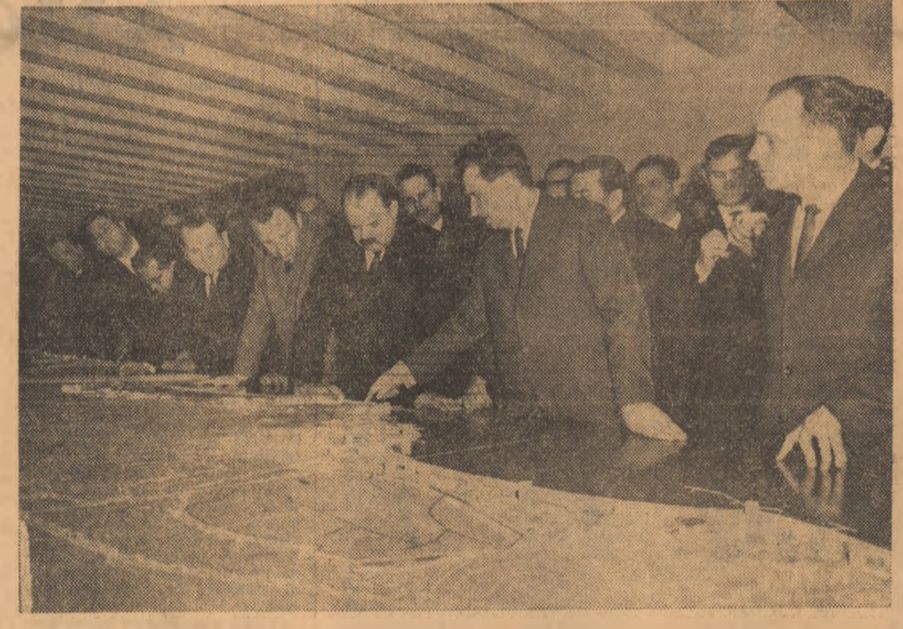
În fața planșelor, edilii litoralului primesc indicații prețioase din partea secretarului general al partidului