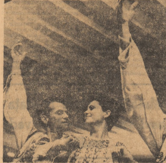
Formația de dansuri a Casei de Cultură din Galați.

glindă deformată, care-i dă un aer ușor caricatural (foarte frumoase sint, în acest sens, decorațiunile și costumele Eleni Fortu).