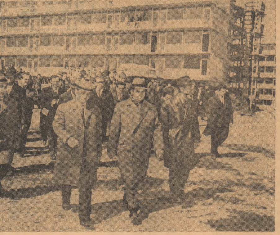
În zona construcțiilor turistice din Mangalia Nord