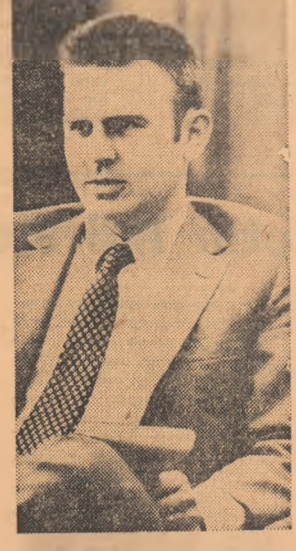
— În luna mai își relinsec activitatea brigăzile noastre de muncă patriotică. Deci, este luna în care renasc șantierul tineretului.

Al treilea element: se apropie luna de vară, ale vacanței școlare, se pregătește „boom”-ul turistic. Chiar îndată după reînnoirea la Belgrad se va desfășura o conferință a Uniunii Tineretului consacrată problemelor turistice. Bineînțeles, mai avem și multe alte preocupări, dar cele pe care le-am amintit sînt primile în ordinea importanței în această lună mai. — În Balcani există toate barierele politice și ideologice ale