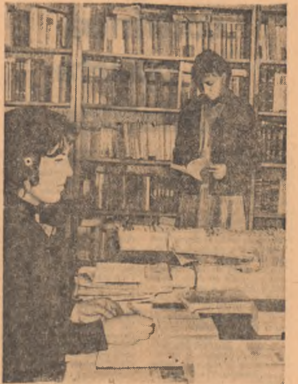
În biblioteca comunei Valul lui Traian, județul Constanța.