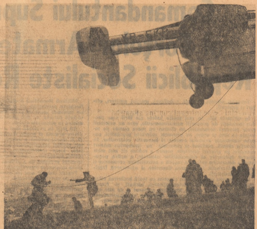
Imaginile vorbesc singure despre marea efort, despre curajul, abnegația și hotărîrea cu care tineri și vîrstnici muncesc pentru salcarea cîștilor omenești, pentru înlăturarea urmărilor calamităților.