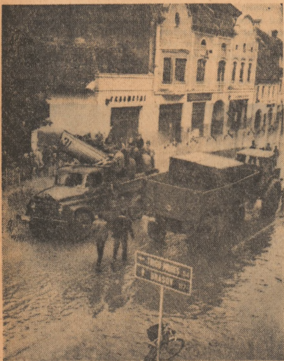
În ciuda condițiilor deosebit de grele, activitatea de salcare a sinistratilor, de lichidare a urmărilor inundațiilor continuă neîntrerupt, cu îndrăzne.

Principalele forțe organizate pentru preîntîmpinarea inundațiilor și reducerea efectelor lor sînt concentrate de-a lungul apelor Someșului, Mureșului, Siretului, Prutului și Oltului. În calca puhoaielor amenințătoare, oamenii opun un adevărat zid de voință și dîrzenie, o muncă de-a dreptul titanică, ce nu cunoaște răgaz. Experiența trăită zilele precedente de așezările acum depășite de viiturile de ape a demonstrat din plin eficiența măsurilor preventive, datorită cărora au putut fi salvate de la pierire vieți omenești, importante valori materiale.