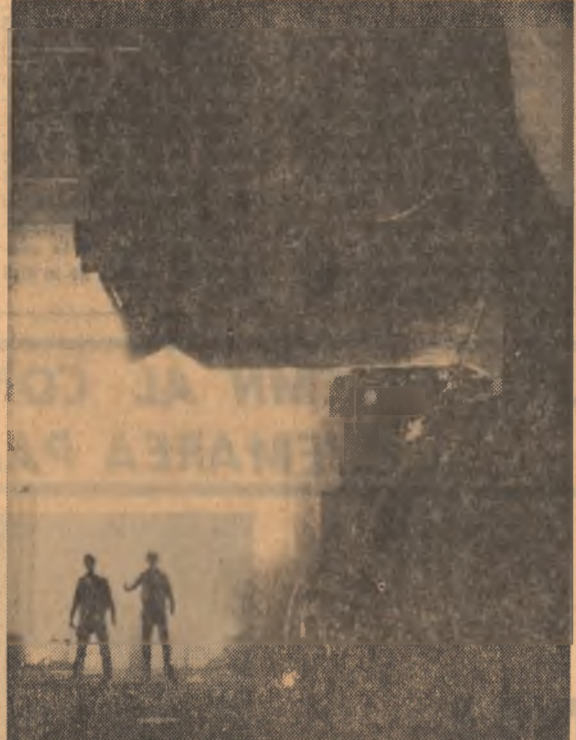
Pe platforma oțelăriei Combinatului siderurgic Galați.