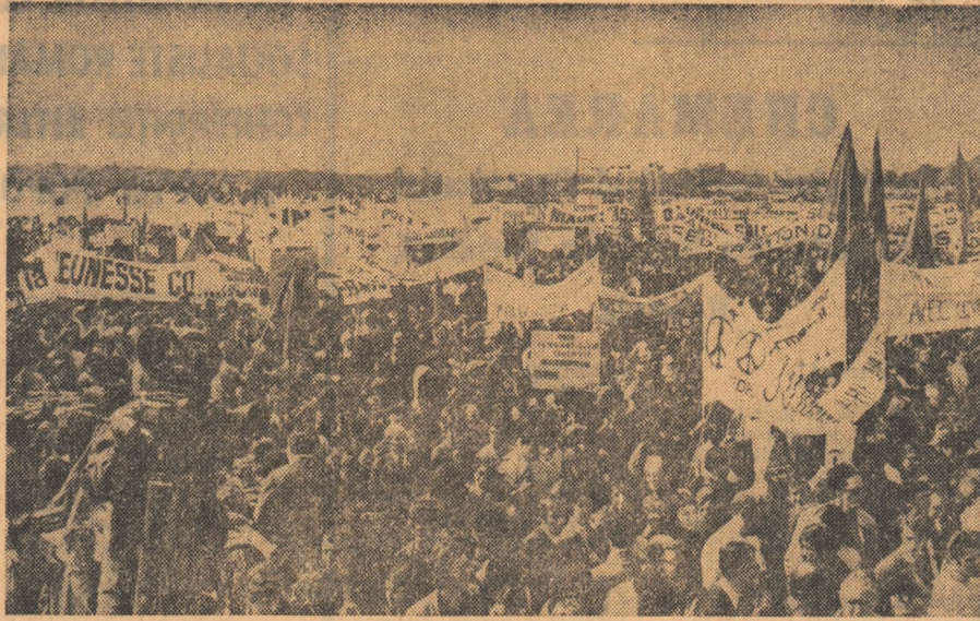
FRANȚA — Demonstrație la Vincennes împotriva intervenției americane din Indochina

Deși mai aveau aproape un an de guvernare, laburiștii au decis să profite de actuala conjunctură economică și politică favorabilă lor. Avansul laburiștilor este explicat prin nivelul favorabil al balanței de plăți externe, apreciat ca „termenul de referință” al economiei a Marii Britanii, coroborat cu alte măsuri economice și financiare cu caracter intern inițiate de laburiști. Alegerile generale britanice de la 18 iunie conțin două noutăți: prima este legată de o recentă reformă a legislației electorale, grație căreia vor vota pentru prima dată tinerii de 18 ani; cealaltă se referă la data alegerilor. Este pentru prima oară în istoria Marii Britanii când astfel de alegeri se țin în luna iunie, respectiv — într-o perioadă de vacanță.