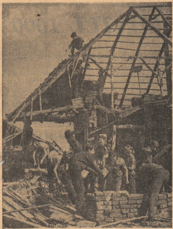
DEJ. Tinerii ajută la reconstruirea caselor

porană; — România și problemele europene; — Pentru lichidarea focarelor de încordare internațională; — Pentru o politică de pace și de dezarmare; — România și Națiunile Unite; — Partidul Comunist Român și mișcarea comunistă și muncitorească internațională; — Perspective. Volumul, care este însoțit și de o notă biografică, cuprinde, de asemenea, numeroase ilustrații înfățișînd pe tovarășul Nicolae Ceaușescu întreținîndu-se cu diferiți șefi de stat din Europa și din alte regiuni ale lumii, precum și cu secretari generali ai unor partide comuniste și muncitorești. La Editura Nagel se află în pregătire același volum în limbile engleză și spaniolă.