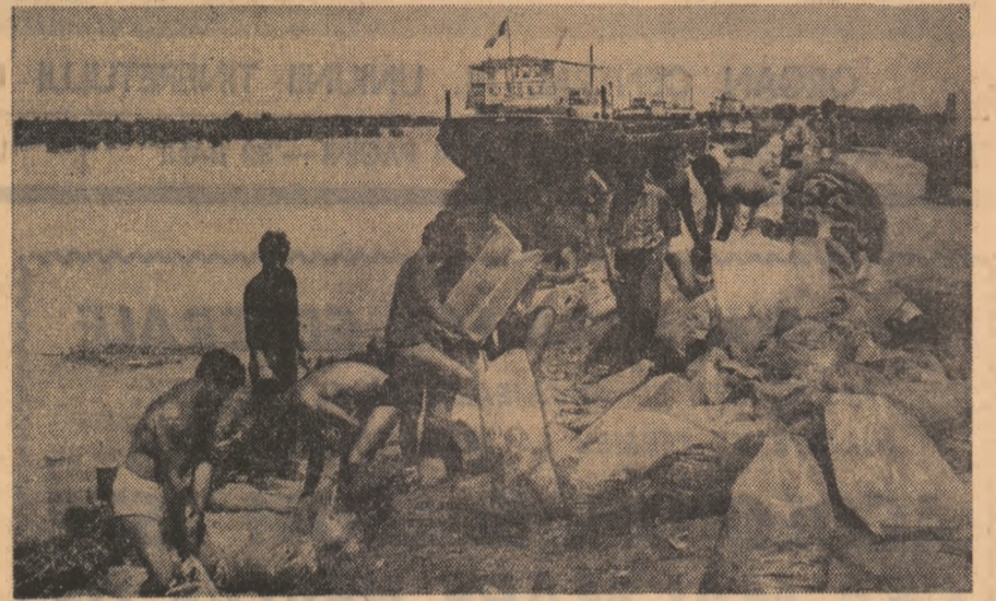
Studentii bucureșteni în Insula Mare a Brăilei.