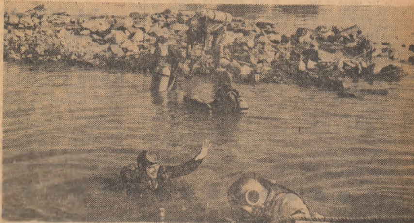
Studenți-scafandri în Insula Mare