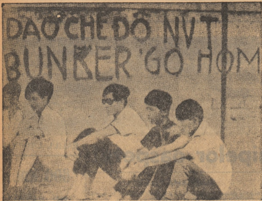
Studentii de la universitatea din Saigon in timpul unei demonstratii anti-americane. Inscrisia de pe perete insemnata: „Jos cu regimul Thieu”