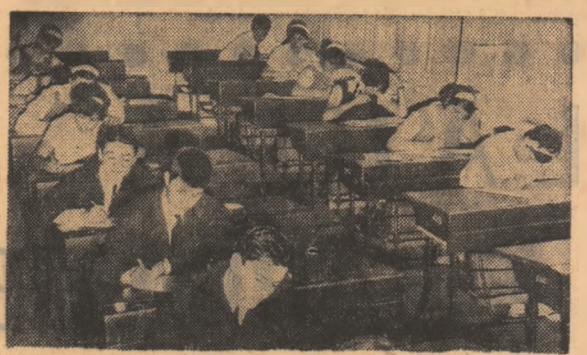
Secvență de la concursul de adîmîtare în clasa a IX-a la Liceul „Aurel Vlaicu” din București.