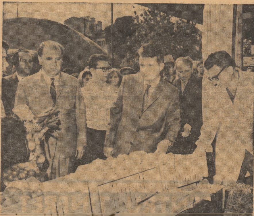
Conducătorul partidului și statului nostru, tovarăș Nicolae Ceaușescu, se interesează îndeaproape de stadiul aprovizionării piețelor, de calitatea produselor.

Următorul punct al itinerarului nostru, tovarăș Nicolae Ceaușescu, se interesează îndeaproape de stadiul aprovizionării piețelor, de calitatea produselor.