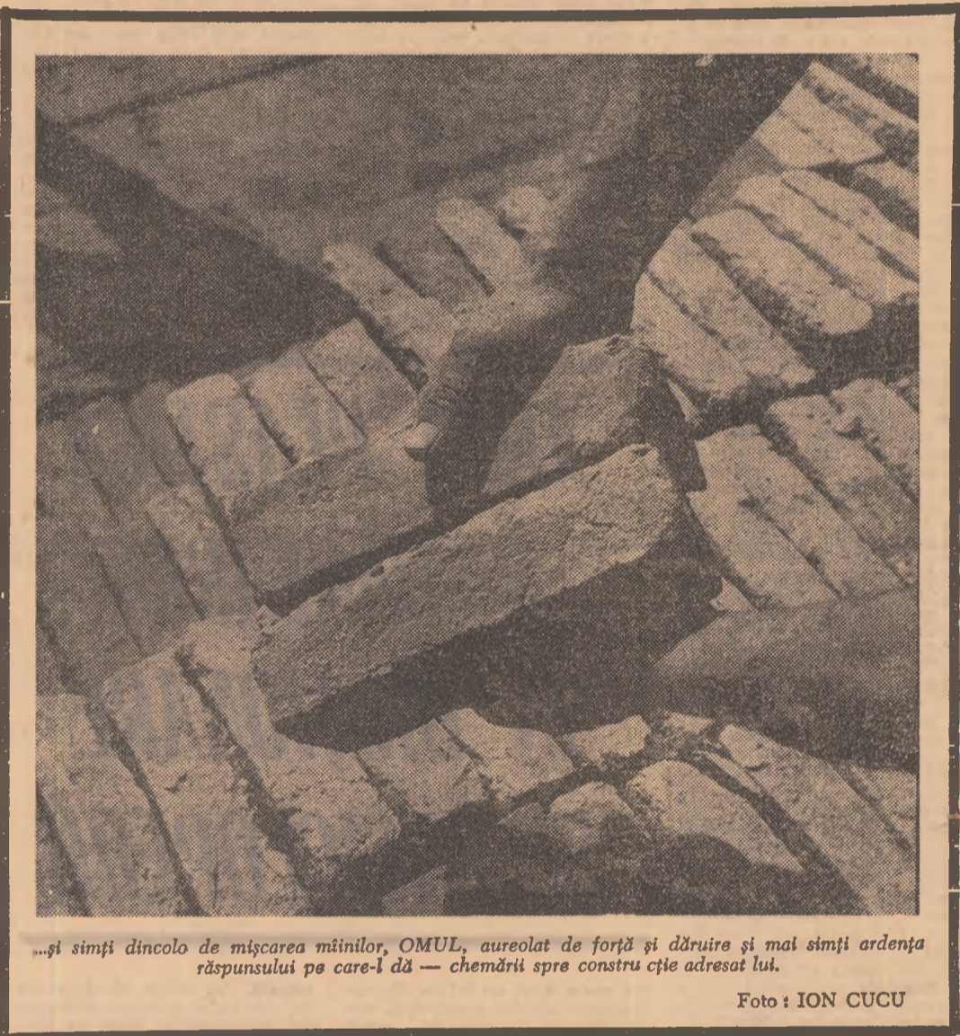
...și simți dincolo de mișcarea mâinilor, OMUL, aureolat de forță și dăruire și mai simți ardența răspunsului pe care-l dă — chemării spre construcție adresat lui.