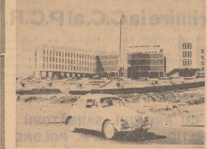
Căderea municipalității din Addis-Abeba

Ziua de 23 iulie, care marchează data nașterii împăratului Halle Selassie I, este sărbătoare națională a poporului etiopian. Situată în estul continentului african, mărginită la răsărit de Marea Roșie și Somalia, la sud de Kenya și la vest de Sudan, Etiopia este una din marile țări ale Africii, avînd o suprafață de 1.222.900 km p și o populație de 23 milioane de locuitori. Pămînt al unei străvechi istorii și civilizații, Etiopia depune în prezent, ca și celelalte state africane, efor-