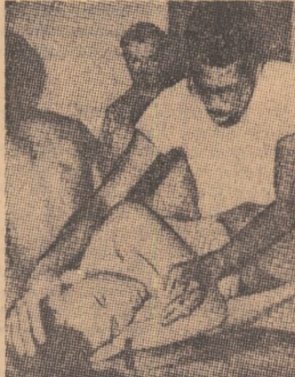
La Houston, în S.U.A., s-au produs noi incidente între poliție și populația de culoare. Fotografia noastră înfățișează o victimă a intervenției sîngeroase a poliției.

Această experiență are ca scop obținerea de date asupra cimpului electromagnetic al atmosferei, prin crearea la o altitudine de peste 200 kilometri a unui nor de vapori de bariu. Acest nor, potrivit calculului cercetătorilor, trebuie să dea naștere unei aurore boreale artificiale vizibile într-o