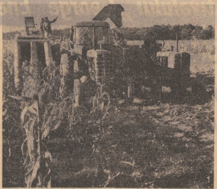
Ca întotdeauna startul se dă în sudul țării: a început recoltatul porumbului.