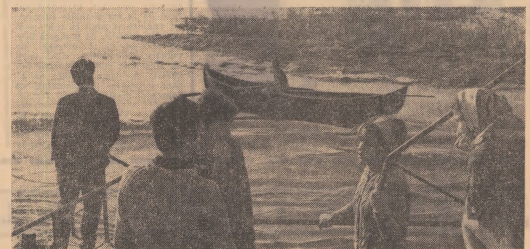
Excursie în împărăția Deltei.