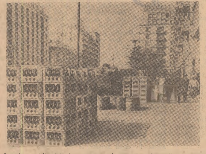
Imagine cotidiană în fața magazii lui „Comalment” București.

sigurate condițiile și un sistem de lucru la nivelul posibilităților. (Amprentele birocrăției!). Cadrele de conducere din majoritatea I.A.S.-urilor din județ au ajuns astfel — neînșurind elevilor nici condiții de cazare în unități — să limiteze contribuția lor zilnică la numai 4—5 ore de muncă. La I.A.S. Călărăși și Mircea Vodă ni s-a replicat cu dezgust că nu fi fost imposibilă cazarea elevilor în unități din cauza lipsei de spațiu și a dificultăților în asigurarea hranei. Adevarul, dovedit concret în alte județe, reflectă însă comoditatea conducătorilor unităților respective „preocuparea” de a nu avea bătaie de cap. Cu răsă judecată, totuși, fiindcă în majoritatea cazurilor elevii au demonstrat că pot să întreținuteze cu folos în sprijinul efectiv al campaniei fiecare ceas.