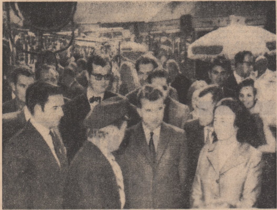
Imagine din timpul vizitei la Hollywood