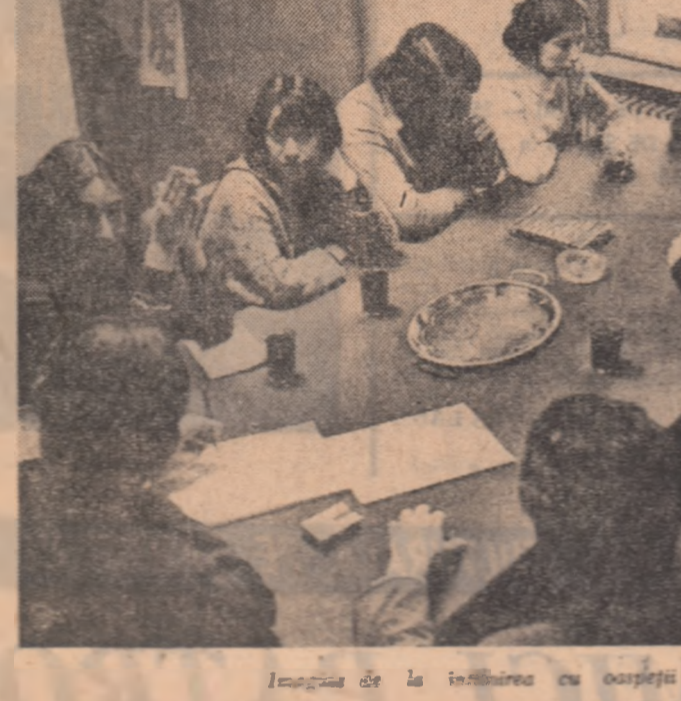
Imagina de la întâlnirea cu oșpeții chilieni.