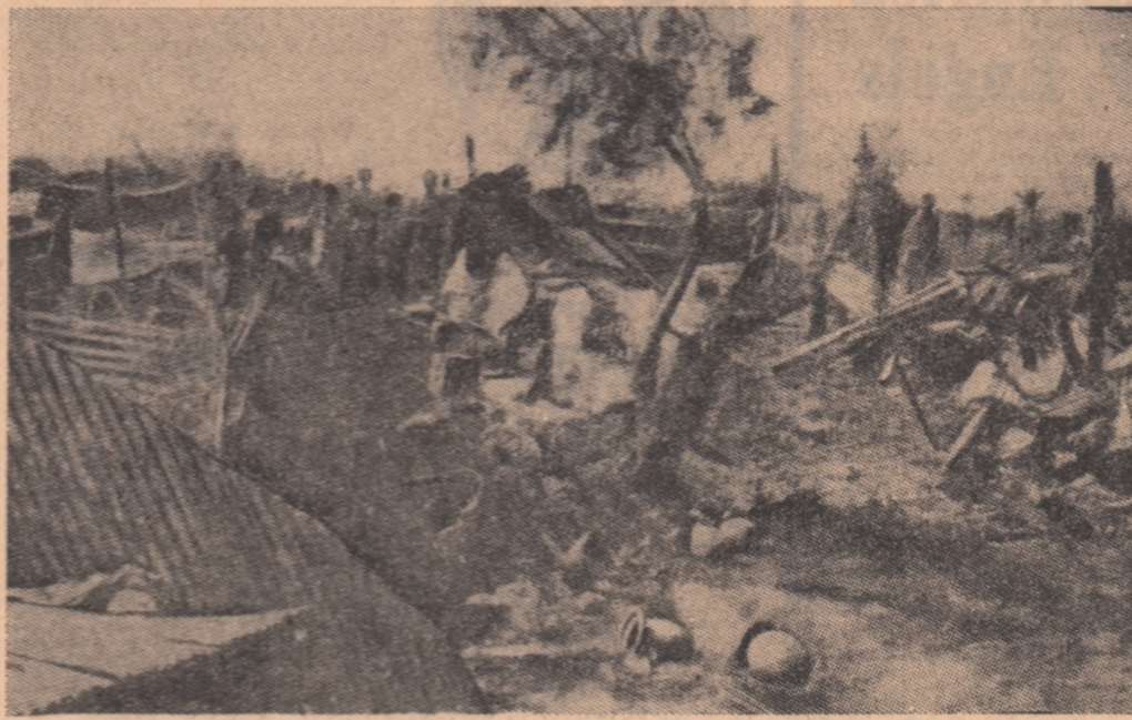
PAKISTANUL DE EST. — Imagine a catastrofelelor distrugerii provocate de recentul ciclon

Popoarele și guvernul Iugoslaviei, se subliniază în declarație, acordă un sprijin deplin poporului prieten al Guineei în apărarea libertății și cuuceririi revoluției. R.S.F.I. sprijină rezoluția Consiliului de Securitate în care se cere încetarea imediată a atacului armat împotriva Republicii Guineea și retragerea acțiunilor a tuturor forțelor armate străine și a mercenarilor de pe teritoriul ei.