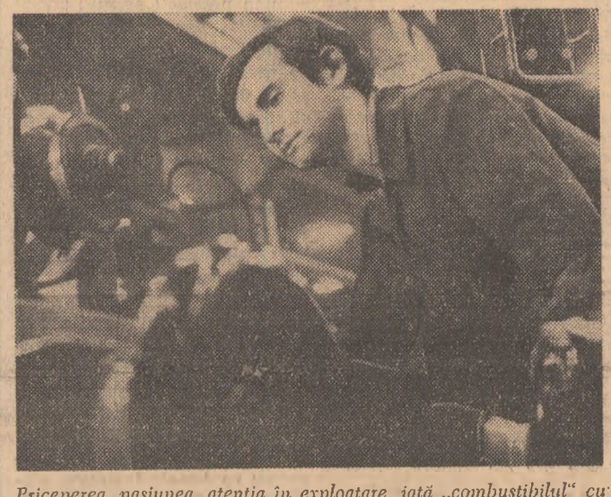
Priceperea, pasiunea, atenția în exploatare, iată „combustibilul” cu care funcționarele utilizează ultramodernul dotare secției prelucrări a F.M.U.A. București

SEMNALAM ÎN RAIDUL-ANCHETA ORGANIZAT DE ZIARUL NOSTRU, PUBLICAT MARTI 12 IANUARIE A.C. EXISTENȚA NEDORITĂ ÎNCA DIN PRIMELE ZILE ALE ANULUI A UNOR DEFICIENȚE ÎN DESFAȘURAREA ACTIVITĂȚII PRODUCTIVE, CAUZATE ÎNDEOSEBI DE UNELE ANOMALII PREZENTE ÎN RELAȚIA FURNIZOR-BENEFICIAR. ÎN DORINȚA DE A CONTRIBUI, DINCOLE DE CONSEMNAȚIA ACESTORA, LA SOLUȚIONAREA LOR CIT MAI RAPIDA NE-AM ADRESAT