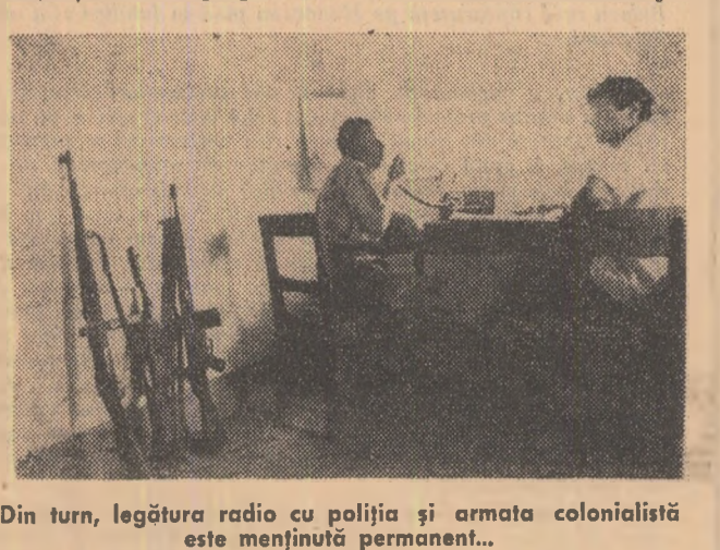
Din turn, legătura radio cu poliția și armata colonialistă este menținută permanent...