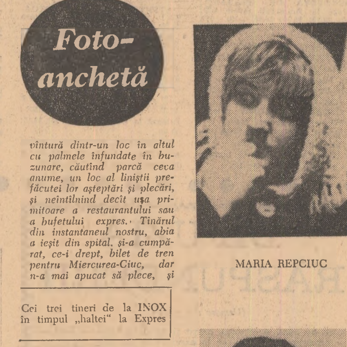
Foto-anchetă vintură dintr-un loc în altul cu palmele înnfundate în buzunare, căuind parcă ceva anume, un loc al liniștii prefăcîtorii lor așteptări și plecări, și neîntîlnind decît ușa primitoare a restaurantului sau a bufetului expres. Tînarul din instantaneul nostru, abia a ieșit din spital, și-a cumpărat, ce-i drept, bilet de tren pentru Miercurea-Ciuc, dar n-a mai apucat să plece, și Continuare în pag. a III-a