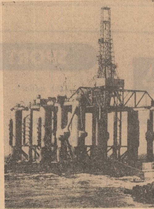
Vor răsări asemenea sonde plutitoare și de-a lungul coastelor sud-vietnameze?

PREȘEDINTELE NIXON a sennat legea cu privire la unele vânzări de arme în străinătate, care cuprind între prevederile ei și anularea faimoasei „rezoluții Tonkin” (legea fusese anterior votată în cele două Camere ale Congresului S.U.A.). După cum se știe, „rezoluția Tonkin”, adoptată în 1964 de Congres, a fost utilizată de președintele Lyndon Johnson pentru angajarea trupelor americane în agresiunea din Vietnam. Actuala administrație a consimțit la anularea rezoluției argumentînd că, pentru menținerea și continuarea participării forțelor americane la războiul din Indochina, nu ar mai fi necesar un act legislativ, fiind suficientă exercitarea drepturilor pe care le are președintele în calitate de comandant-șef al armatei.