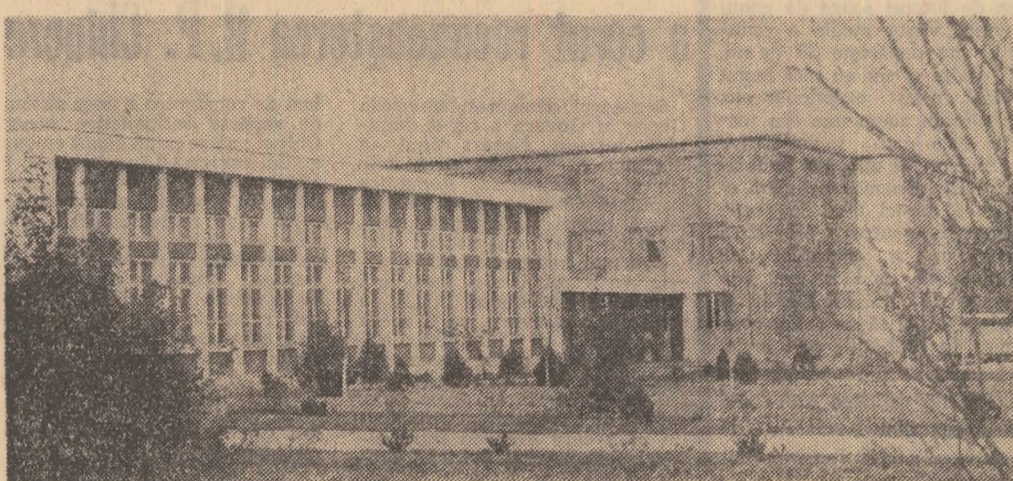
În arhitectura recentă a orașului Luduș se încadrează și noua casă de cultură

În CINCINAL s-au construit 417 noi săli de clasă