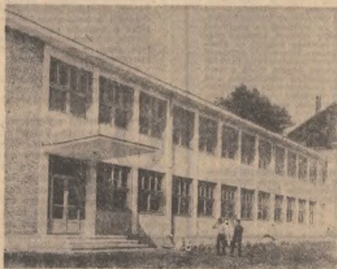
Școala generală din Tîrnăveni dată în folosință în 1970

● ÎN PEISAJUL UNIVERSITAR AU APĂRUT — O FACULTATE LA INSTITUTUL PEDAGOGIC — UN CĂMIN CU PESTE 300 DE LOCURI