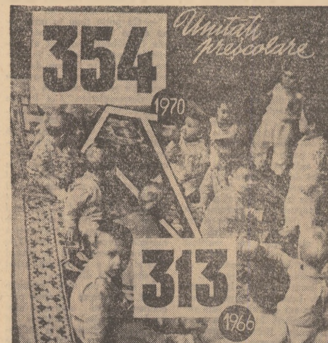
În 1970, în aceste unități erau cuprinși 60 la sută din copiii de vîrstă preșcolară — adică 17 266, față de 13 821 în 1966.

● 200 000 volume au îmbogățit fondul de cărți al bibliotecilor publice