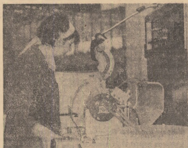
Profesii inedite pentru tinerele fete la întreprinderea „Metalotehnică” din Tg. Mureș

● 25 DE ANI LA FABRICA DE PIELARIE SI MA NUSI ● 26 DE ANI LA COMBINATUL DE INGRASAMINTE AZOTOASE, ÎNTREPRINDERE DE UTILAJE PENTRU INDUSTRIA USOARA, COMPLEXUL DE PRELUCRARE A LEMNULUI DE LA REGHIN ● 27 DE ANI LA COMPLEXUL DE FAIANTA SI STICLA DIN SIGHISOARA