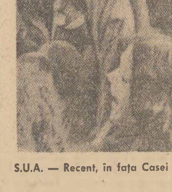
S.U.A. — Recent, în fața Casei Albe a avut loc o demonstrație de protest împotriva intervenției americano-saigoneze în Laos

● PARTICIPANȚII la Conferința internațională „Studenții și mișcarea de eliberare africană”, care își desfășoară lucrările în capitala Finlandei, au condamnat intervenția forțelor armate americane-saigoneze în Laos. Într-o telegramă adresată organizațiilor de tineret și studenți din Laos, Cambodgia și Vietnamul de sud se subliniază necesitatea ca Statele Unite să pună capăt războiului agresiv din Indochina și să trage, imediat și necondiționat, rețeaua lor și ale aliaților lor din această regiune.