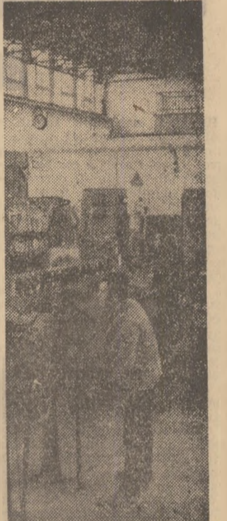
Sala compresoarelor de la Combinatul de îngrășămînt azotat din Piatra Neamț

Între organizațiile de tineret din uzinele constructoare de mașini s-a declanșat întrecerea în producție dotată cu „Cupa calității” la următoarele obiective: realizarea cantitativă și calitativă a sarcinilor de producție, economia de energie, materii prime și materiale, organizarea rațională a locurilor de muncă și ridicarea măiestriei profesionale.