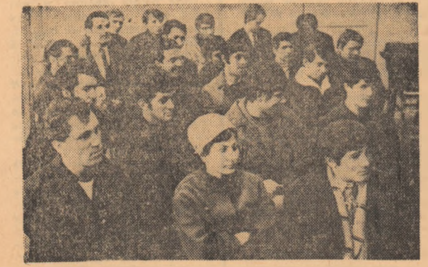
Adunarea generală — momentul noului start