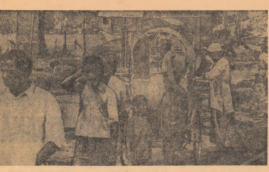
Imagini din capitala Pakistanului oriental, Dacca, după ciocnirile care au avut loc

Ministrul de externe chilian, Clodomiro Almeyda-Medina, a declarat într-o conferință de presă că acordul semnat de curînd la Berlin prin care guvernul Republicii Chile și Republicii Democratice Germane au hotărît să stabilească relații diplomatice se bazează pe recunoașterea principiilor și țelurilor Cartei O.N.U. cu privire la suveranitatea și egalitatea în drepturi ale statelor și la neamestecul în treburile lor interne. Totodată, a precizat ministrul chilian, ambele guverne și-au exprimat dorința de a colabora cu eficiență în domeniile economiei, științei și culturii și de a-și întări relațiile comerciale.