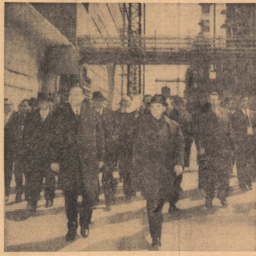
În vizită la Combinatul chimic Sumgait