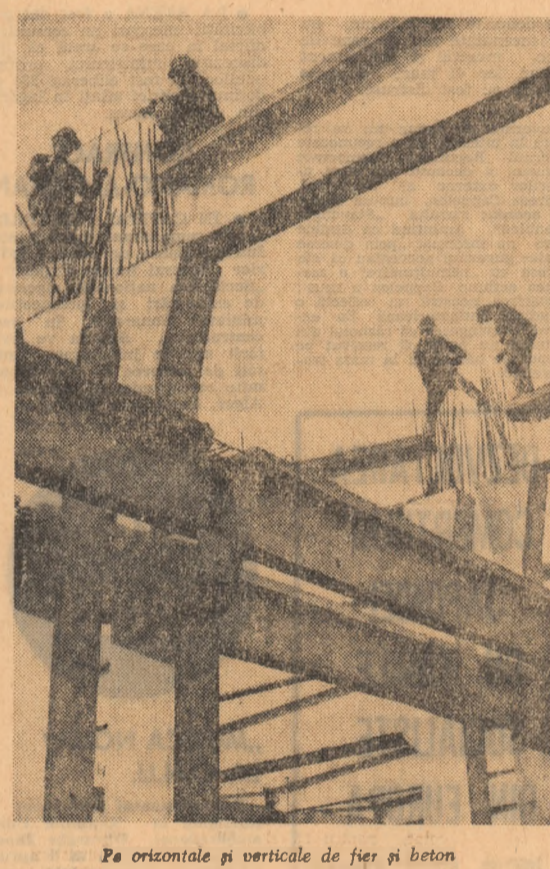
Pe orizontale și verticale de fier și beton

După cum au apreciat participanții la constituirea — oameni de teatru, ziaristi, acțiunile de lucru organizate de membri ai comisiilor de organizare și selecție — cu prilejul Finalului vom asista la o mișcare teatrală românească, cu atât mai interesantă și eficientă cu cât, spre deosebire de alte manifestări similare, anul acesta, „Zilele...” vor cuprinde nu numai spectacole, ci și sesiuni de comunicare, întâlniri cu publicul și presa, schimburi de opinii între colectivele artistice. De subliniat că, în afară de concurenți, 100 de oameni de teatru din întreaga țară vor asista, ca invitați ai Direcției Teatrelor, la toate spectacolele și lucrările acestei importante manifestări artistice.