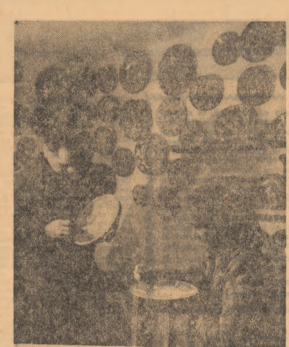
Ceramica — moștenea multiseclară, moștenit din tată în fiu, ridicat la rangul de artă

— Critica nu ignoră fenomenul „tînar”, ba chiar, în multe cazuri, îl exagerază. Eu reproșez criticii faptul că nu reușește (nu dorește, de fapt, poate nu are curajul, căci altfel cu siguranță ar reuși) să facă dezbateri problematice, să aprecieze intelectual subiectele cărților, temele lor, concluziile lor, de unde și lipsa de consecvență a criticilor profesioniști, care la fiecare carte adoptă altă gîndire și altă viziune despre frumos, schimbîndu-și unghiul de vedere cel puțin de patru ori pe lună. Cel puțin în ce mă privește, constat că tocmai problemele pe care vîrstă de critică le are, și a început să se creeze un leit-motiv despre tînărimea de București, despre un anumit stil „americanesc” (adică perentant, chiar, sincer, ca și cum asemenea calități un scriitor ro-