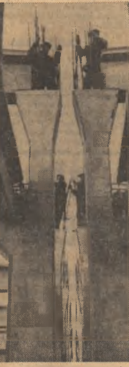
Aici se construiește fabrica de strunguri din Tirgoviște

torii și l-au părăsit 796. Dintre aceștia 521 au plecat prin demision. Anul trecut, la Șantierul 1 s-au angajat 2.200 muncitori și au plecat 1.200. În aceste condiții, întrebă, ești obligat să o faci? De ce vă pleacă colegii de pe șantier? Am adresat și noi întrebarea unui foarte mare număr de muncitori înfiliți la diferitele puncte de lucru de pe platformă. Simpla înțelegere a constatărilor este în măsură să convingă pe oricine că muncitorii nu pleacă fără motive bine întemeiate. Inclusiv conducerea Grupului de șantier Tirgoviște, șefii de lot, maistrii și inginerii trebuie să se con-