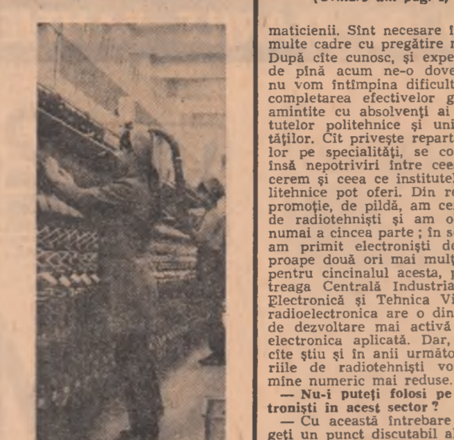
La "Argeșana" din Pitești